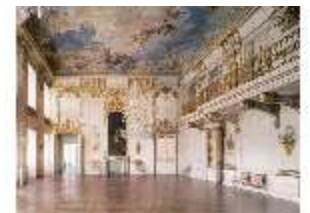
AnsRes.II, Fliesensaal, R.2, DE000888, BSV-