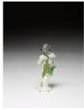
AnsRes.III,K, Putto als Trommler, DI016137, BSV-