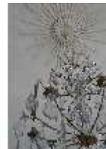
AnsRes.II, Zweites Vorzimmer des Markgrafen (R.4), Kronleuchter, DI024019, BSV-