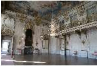
AnsRes.II, Festsaal, R. 2, DI023963, BSV-