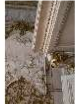
AnsRes.II, Festsaal, R. 2, Stuckrelief, DI024109, BSV-