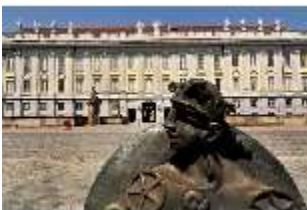
AnsRes.I, Residenz, Hauptfassade, DI000697, BSV