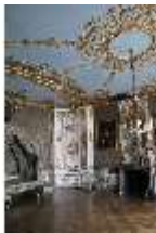
AnsRes.II, Schlafzimmer des Markgrafen, R. 6, DI013321, BSV-