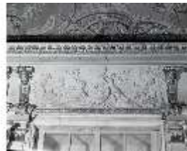
AnsRes.II, Relief "Dezember...", R.2, DE003783, BSV-