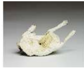
AnsRes.III,K, Kleiner liegender Mops, DI016154, BSV-