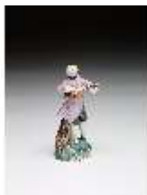
AnsRes.III,K, Kavalier mit Laute, DI016090, BSV-