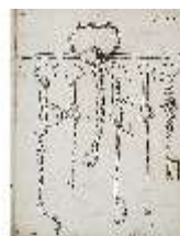
AnsRes.III,V, Der vollkommene Pferde-Kenner, DI015980, BSV-