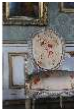
AnsRes.II, Galerie (R. 26), DI024044, BSV-