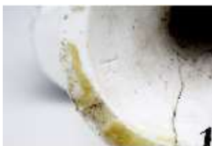
AnsRes.III,K, Büste Joseph II., Marke, AnsRes.K1232, DI022698, BSV-