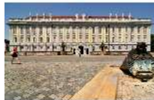
AnsRes.I, Residenz, Hauptfassade, DI000699, BSV