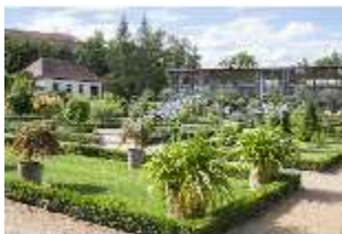
AnsRes.V, Heilkräutergarten mit Citrushaus, DI005690, BSV