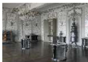
AnsRes.II, Fliesensaal, "Ordinäres Tafelzimmer" R. 24, DI013339, BSV-