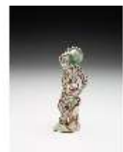
AnsRes.III,K, Harlekin, DI017307, BSV-