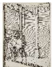
AnsRes.III,V, Der vollkommene Pferde-Kenner, DI015973, BSV-