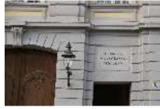
AnsRes.I, Residenz, Hauptfassade, Detail: Seitenportal, DI024131, BSV-