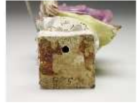
AnsRes.III,K, Europa, DI017228, BSV-