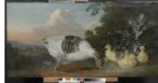
AnsRes.III, G, Tiergruppe, Samuel Beck, DI005008, BSV-