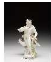
AnsRes.III,K, Jupiter, DI016068, BSV-