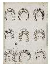
AnsRes.III,V, Der vollkommene Pferde-Kenner, DI015981, BSV-