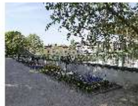
AnsRes.V, Leonhart-Fuchsgarten, DI022336, BSV-