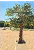
AnsRes.V, Palme im Hofgarten, DI019498, BSV