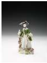
AnsRes.III,K, Jägerin, DI017310, BSV-