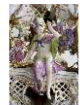
AnsRes.III,K, Kronleuchter (Detail); AnsRes.K0737, DI022255, BSV