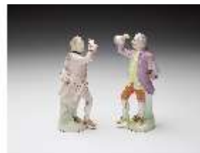
AnsRes.III,K, Kavaliere, DI017346, BSV-