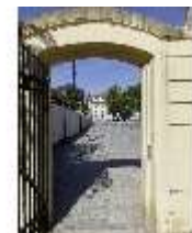
AnsRes.V, Hofgarten, Nordwest-Tor (?), DI022298, BSV