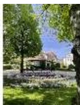
AnsRes.V, Hofgarten, DI022312, BSV