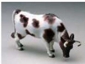
AnsRes.III, K, Stier, K 263, DE003047, BSV-