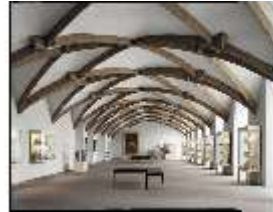
AnsRes.II, Gotischer Saal, DE003231, BSV-