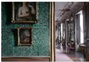
AnsRes.II, Bilderkabinett, R. 27, DI024103, BSV-