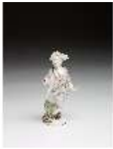
AnsRes.III,K, Kavalier mit Blumen, DI016062, BSV-