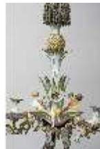
AnsRes.III,K, Kronleuchter (Detail); AnsRes.K0737, DI022270, BSV