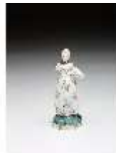
AnsRes.III,K, Miniaturfigur einer Dame, DI016051, BSV-