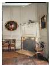
AnsRes.II, Dienerschaftszimmer (R.16), DE003221, BSV