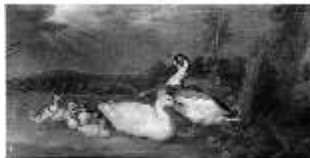
AnsRes.III, G0015.02 Tiergruppe, DE000588, BSV-