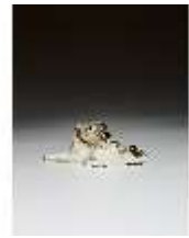
AnsRes.III,K, Kleiner liegender Mops, DI016155, BSV-