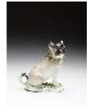
AnsRes.III,K, Größerer Mops, DI016167, BSV-