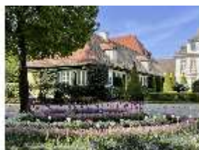
AnsRes.V, Hofgarten, DI022313, BSV