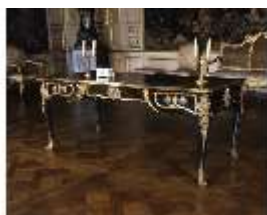
AnsRes.III, Bureau Plat, M 49, DE003569, BSV-