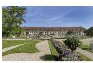
AnsRes.V, Hofgarten, Orangerie mit Blumenrabatten, DI022305, RSV