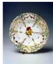
AnsRes.III, K, Teller, K 374, DE003046, BSV-