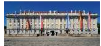
AnsRes.I, Residenz, Hauptfassade, DI000703, BSV