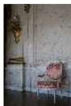
AnsRes.II, Sessel im Festsaal, R. 2, DI023960, BSV-