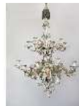
AnsRes.III,K, Kronleuchter (Porzellan); AnsRes.K0737, DI022253, BSV