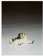
AnsRes.III,K, Kleiner liegender Mops, DI016152, BSV-