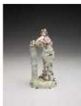
AnsRes.III,K, Einigkeit, DI017233, BSV-