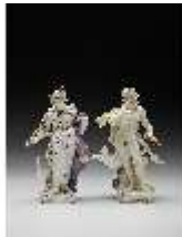
AnsRes.III,K, Serie "Antike Götter", Juno und Jupiter, DI016177, BSV-