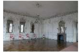
AnsRes.II, Zweites Vorzimmer des Markgrafen (R.4), DI024018, BSV-