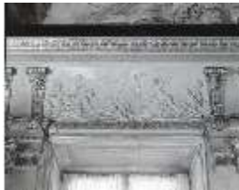
AnsRes.II, Relief "Feuer", R.2, DE003779, BSV-