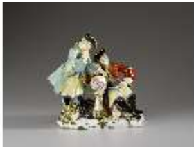
AnsRes.III,K, Freimaurergruppe, Inv.-Nr. AnsRes.K0514, DI012831, BSV-