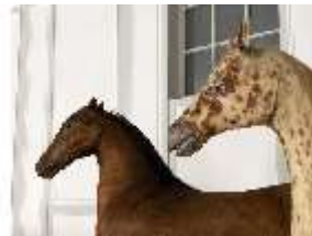
AnsRes.III,P, Pferdepräparate, DI018740, BSV-