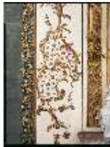
AnsRes.II, Audienzzimmer R.21, Detail, DE003225, BSV