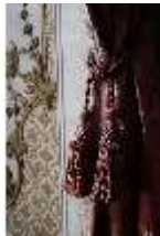
AnsRes.II, Marmorkabinett, R.8, Det. Vorhang, DI023991, BSV-