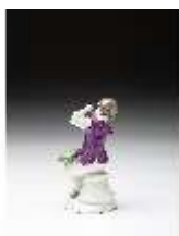
AnsRes.III,K, Knabe mit Trauben, DI016101, BSV-