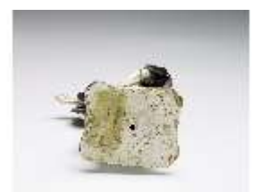
AnsRes.III,K, Heilige Therese, DI016103, BSV-