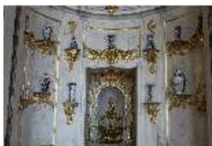
AnsRes.II, Schranknische, Festsaal (R. 2), DI024035, BSV-