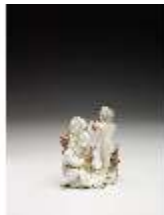
AnsRes.III,K, Winter, Puttengruppe, DI017216, BSV-