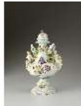
AnsRes.III,K, Vase, Inv.-Nr. AnsRes.K0710, DI012845, BSV-