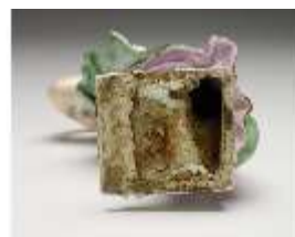
AnsRes.III,K, Amerika, DI017231, BSV-