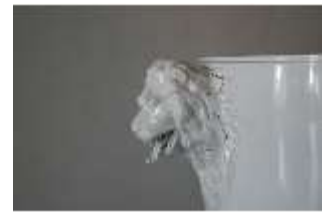
AnsRes.III,K, Deckelvase mit Löwenkopfenkeln, AnsRes.K0494, DI024028, RSV-