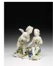
AnsRes.III,K, Zwei Putti mit Blumengirlanden, DI016035, BSV-