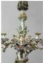
AnsRes.III,K, Kronleuchter (Detail); AnsRes.K0737, DI022264, BSV