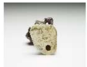
AnsRes.III,K, Scapin, DI017273, BSV-