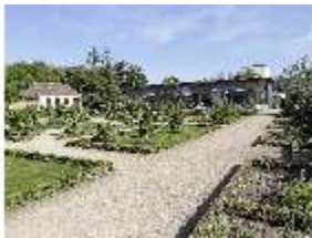
AnsRes.V, Leonhart-Fuchsgarten, DI022330, BSV-