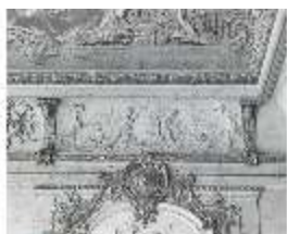
AnsRes.II, Relief "März...", R.2, DE003768, BSV-