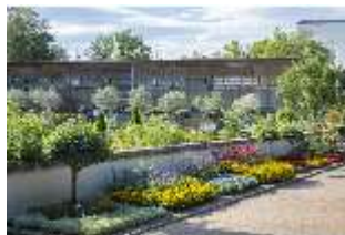
AnsRes.V, Heilkräutergarten mit Citrushaus, DI005705, BSV