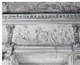
AnsRes.II, Relief "Juni...", R.2, DE003771, BSV-