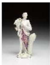
AnsRes.III,K, Ceres, DI016044, BSV-