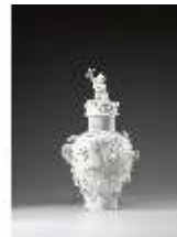
AnsRes.III,K, Deckelvase, Inv.-Nr. AnsRes.K0728, DI012867, BSV-