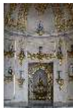
AnsRes.II, Schranknische, Festsaal (R. 2), DI024037, BSV-