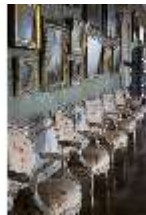
AnsRes.II, Galerie (R. 26), DI024045, BSV-