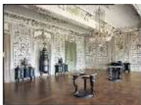
AnsRes.II, Fliesensaal (R.24), DE001168, BSV-