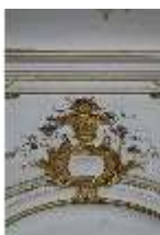
AnsRes.II, Galerie (R. 26), Detail Wanddekoration, DI024097, BSV-