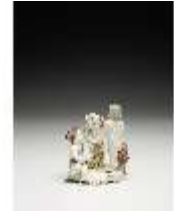
AnsRes.III,K, Winter, Puttengruppe, DI017215, BSV-