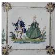
AnsRes.II, Fliese im Fliesensaal, R. 24, DI023952, BSV-