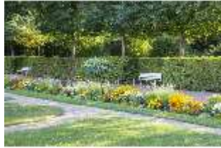
AnsRes.V, Parterre, Blumenrabatte, DI005680, BSV