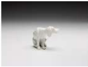
AnsRes.III,K, Jagdhund, DI017328, BSV-