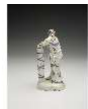
AnsRes.III,K, Einigkeit, DI017236, BSV-