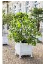
AnsRes.V, Orangerie mit Pflanzkübel, DI005640, BSV