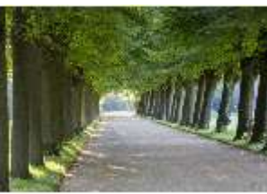
AnsRes.V, Lindenallee, DI005655, BSV