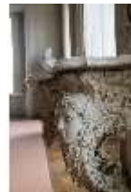
AnsRes.II, Zweites Vorzimmer des Markgrafen (R.4), Konsoltisch, DI024015, BSV-