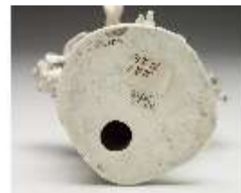
AnsRes.III,K, Venus mit Amor, DI017214, BSV-