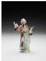
AnsRes.III,K, Pope, DI017288, BSV-