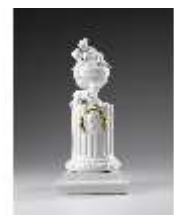
AnsRes.III,K, Zweites Gellert- Monument, Inv.-Nr. AnsRes.K1233, DI012875, BSV-