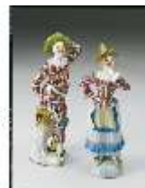
AnsRes.III, K, Harlekin und Colombine, DE002061, BSV-