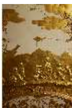
AnsRes.II, Schlafzimmer der Markgräfin, Deckenstück, DI023990, BSV-