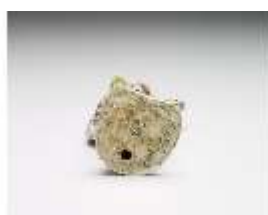
AnsRes.III,K, Harlekin, DI017309, BSV-