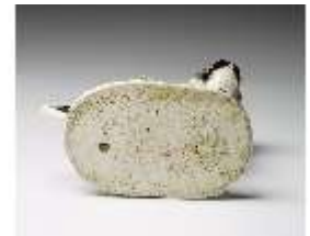
AnsRes.III,K, Größerer Mops, DI016171, BSV-