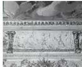
AnsRes.II, Relief "Gerechtigkeit", R.2, DE003782, BSV-