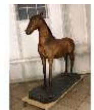
AnsRes.III,P, Pferdepräparat, DI018733, BSV-