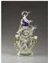
AnsRes.III,K, Phantasieformuhr, Inv.-Nr. AnsRes.K1241, DI012885, RSV-