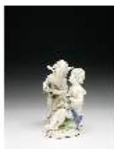
AnsRes.III,K, Zwei Putti mit Blumengirlanden, DI016036, BSV-