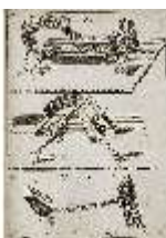
AnsRes.III,V, Der vollkommene Pferde-Kenner, DI015974, BSV-