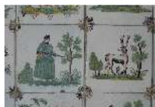
AnsRes.II, Fliesen im Fliesensaal, R. 24, DI023972, BSV-