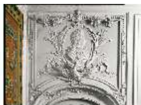
AnsRes.II, Vorzimmer der Galerie R.25, Supraporte, DE003228, BSV