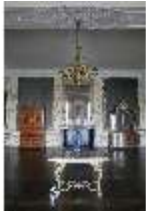
AnsRes.II, Gästeappartement Audienzzimmer (R. 21), DI013348, BSV-