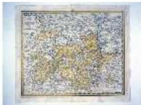
AnsRes.IV, Landkarte Ansbach und Umgebung, BSV-Grafikslg., DE001643, BSV