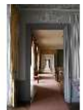
AnsRes.II, Enfilade, DI013345, BSV-