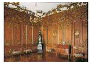
AnsRes.II, R11, Wohnzimmer, DE003216, BSV-