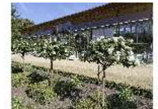
AnsRes.V, Leonhart-Fuchsgarten, DI022335, BSV-