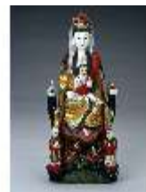
AnsRes.III,K, Göttin Guanyin, AnsRes.K522, DE003050, BSV-