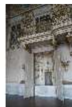
AnsRes.II, Festsaal (R. 2), Schranknische, DI013355, BSV-