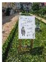
AnsRes.VII, Kräuterausstellung "Kräuterfarben" (2023), DI026682 BSV.