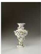
AnsRes.III,K, Potpourrivase, Inv.-Nr. AnsRes.K0712, DI012860, BSV-