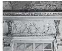
AnsRes.II, Relief "Erde", R.2, DE003777, BSV-