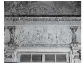
AnsRes.II, Relief "Januar...", R.2, DE003766, BSV-