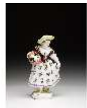
AnsRes.III,K, Gärtnerin, DI016072, BSV-