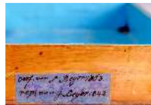
AnsRes.III,M, Ziertischchen "Table à Écrire", Inv. AnsRes.M0061, R.7, DE001430 BSV