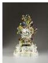
AnsRes.III,K, Stockuhr, Inv.- Nr. AnsRes.K1242, DI012889, BSV-