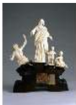
AnsRes.III,P, Allegorie des Friedens, DE003520, BSV-