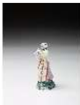
AnsRes.III,K, Bäuerin mit Hahn, DI016092, BSV-