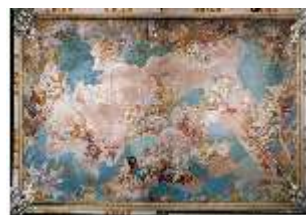
AnsRes.II, Festsaal (R.2), Deckenfresko, DE000677, BSV-