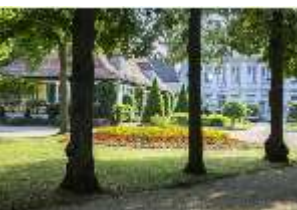
AnsRes.V, Parterre, Blick aus der Allee, DI005704, BSV