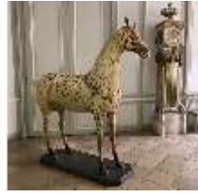
AnsRes.III,P, Pferdepräparat, DI018736, BSV-