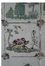
AnsRes.II, Fliese im Fliesensaal, R. 24, DI024061, BSV-