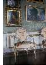
AnsRes.II, Galerie (R. 26), DI024042, BSV-