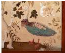
AnsRes.III,M,Ofenschirm, Kat.92, R.16, DE001432, BSV