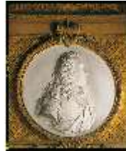
AnsRes.II, Kabinett des Gästeappartements, Detail der Vertäfelung, DE003223, BSV-