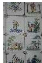
AnsRes.II, Fliesen im Fliesensaal, R. 24, DI023973, BSV-