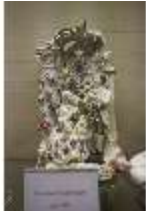
AnsRes.III,K, Liebespaar in der Laube, AnsRes.K0507, DI023958, BSV-