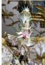
AnsRes.III,K, Kronleuchter (Detail); AnsRes.K0737, DI022261, BSV