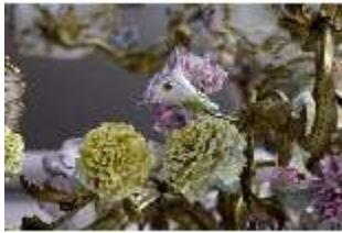
AnsRes.III,K, Kronleuchter (Detail); AnsRes.K0737, DI022260, BSV