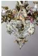
AnsRes.III,K, Kronleuchter (Detail); AnsRes.K0737, DI022265, BSV