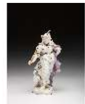
AnsRes.III,K, Juno, DI016064, BSV-