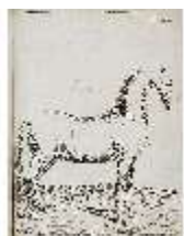
AnsRes.III,V, Der vollkommene Pferde-Kenner, DI015965, BSV-