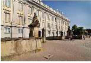
AnsRes.I, Residenz, Hauptfassade, Detail, DI000695, BSV