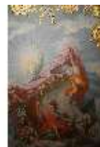
AnsRes.II, Spiegelkabinett, Det. Deckengemälde, R. 10, DI023979, BSV-