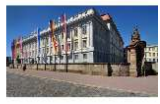
AnsRes.I, Residenz, Hauptfassade, Schrägansicht, DI000691, BSV