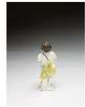
AnsRes.III,K, Putto mit Gießkanne, DI016129, BSV-