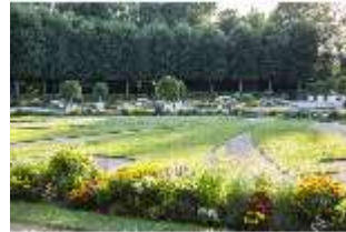
AnsRes.V, Parterre, Blumenrabatten, DI005683, BSV