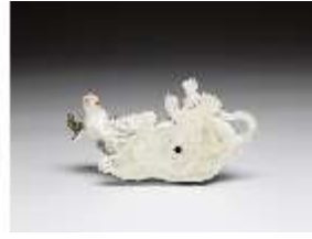
AnsRes.III,K, Liegende Kuh, DI016140, BSV-