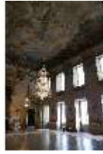
AnsRes.II, Festsaal, R. 2, DI024040, BSV-