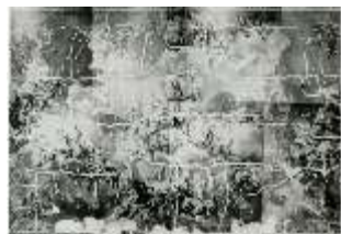
AnsRes.II, Fliesensaal, Schaden 1954, R.2, DE003707, BSV-