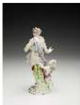
AnsRes.III,K, Venus mit Amor, DI017213, BSV-