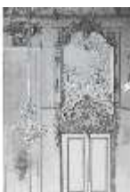
AnsRes.II, Supraportenrelief/West, R.2, DE003763, BSV-