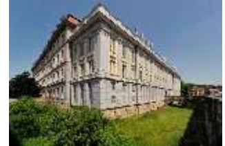
AnsRes.I, Residenz, Schrägansicht von Süden, DI000701, BSV