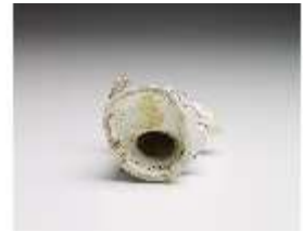
AnsRes.III,K, Schäferin, DI017293, BSV-