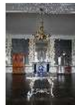
AnsRes.II, Audienzzimmer d. Gästeappartements (R. 21), DI024082, BSV-