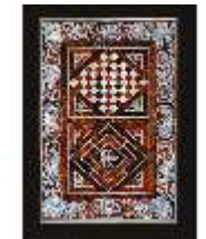
AnsRes.III,M, Spieltischplatte, M 111, DE001377, BSV-