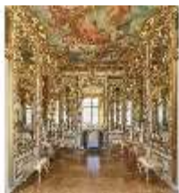
AnsRes.II, Spiegelkabinett im Appartement der Markgräfin, DI016451, BSV