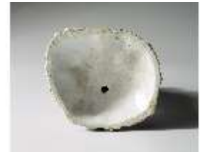
AnsRes.III,K, Diana, DI016050, BSV-