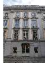
AnsRes.I, Arkadenhof, DI024122, BSV-