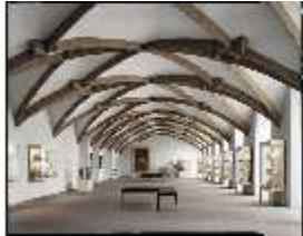
AnsRes.II, Gotische Halle, DE000678, BSV-