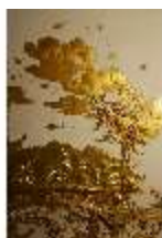
AnsRes.II, Schlafzimmer der Markgräfin, Deckenstück, DI023985, BSV-