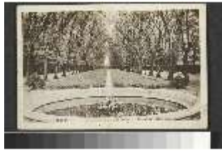
AnsRes.III,V, hist. Postkarte vom Hofgarten Ansbach, DI020357, BSV