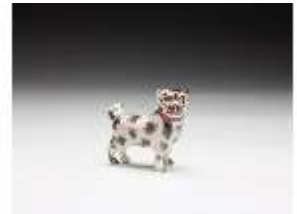
AnsRes.III,K, Mops, DI017324, BSV-