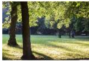
AnsRes.V, Jägerwiese, DI005648, BSV