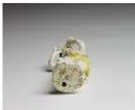
AnsRes.III,K, Putto mit Waldhorn, DI016121, BSV-