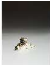
AnsRes.III,K, Kleiner liegender Mops, DI016153, BSV-