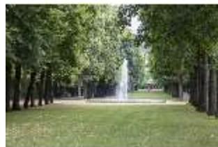
AnsRes.V, Linden-Allee, DI005702, BSV