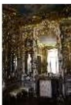
AnsRes.II, Spiegelkabinett im Appartement der Markgräfin (R. 10), DI013316, BSV-