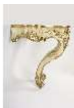
AnsRes.III,M, Konsoltisch (freigelegt), AnsRes.M0066, DI001935, BSV