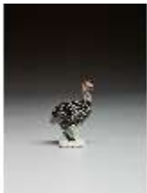
AnsRes.III,K, Perlhuhn, DI016143, BSV-