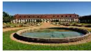
AnsRes.V, Hofgarten und Orangerie, DI000679, BSV