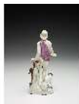
AnsRes.III,K, Meleager, DI017256, BSV-