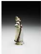
AnsRes.III,K, Türke mit Pelzmantel, DI017279, BSV-