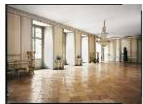
AnsRes.II, Gardesaal oder Vorsaal R.1, DE002995, BSV-