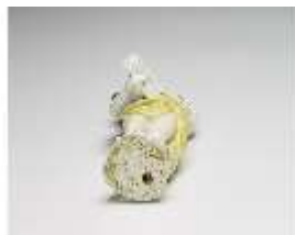
AnsRes.III,K, Putto mit Violine, DI016135, BSV-