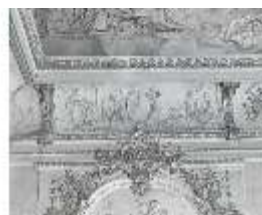
AnsRes.II, Relief "Oktober...", R.2, DE003775, BSV-