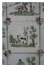
AnsRes.II, Fliese im Fliesensaal, R. 24, DI024059, BSV-