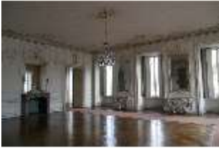
AnsRes.II, Zweites Vorzimmer des Markgrafen (R.4), DI013326, BSV-