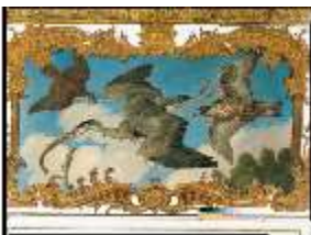
AnsRes.II, Schlafzimmer R.6, Supraporte, DE003213, BSV-