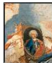
AnsRes.II, Festsaal, Deckenfresko, Detail: Markgraf Carl Wilhelm Friedrich, DE002233, BSV-