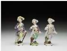
AnsRes.III,K, Schäferjunge Serie „Kleine Gärtnerkinder“, DI016181, BSV-