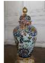
AnsRes.III,K, Japanische Deckelvase, AnsRes.K0695, DI024023, BSV-