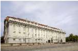
AnsRes.I, Hauptfassade, DI016450, BSV