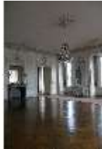
AnsRes.II, Zweites Vorzimmer des Markgrafen (R.4), DI024012, BSV-