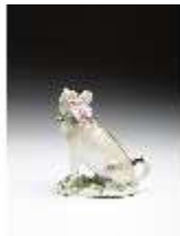
AnsRes.III,K, Größerer Mops, DI016168, BSV-