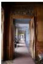
AnsRes.II, Enfilade, DI013346, BSV-