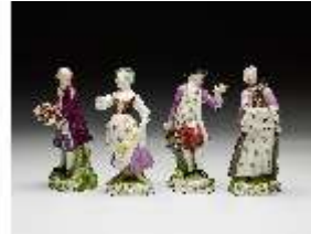
AnsRes.III,K, Folge der "Jahreszeiten", DI016179, BSV-