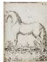
AnsRes.III,V, Der vollkommene Pferde-Kenner, DI015964, BSV-