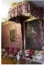
AnsRes.II, Audienzzimmer des Markgrafen, R. 5, Deckenstück, DI024007, BSV-