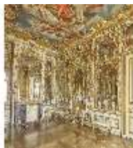
AnsRes.II, Spiegelkabinett im Appartement der Markgräfin, DI016452, BSV