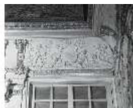
AnsRes.II, Relief "November...", R.2, DE003776, BSV-