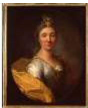
AnsRes.III,G, Porträt Hippolyte Clairon, DE003401, BSV-