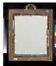
AnsRes.III, Madame Clairon, G0038, DI003098