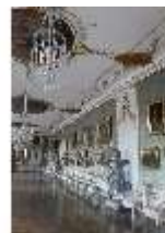
AnsRes.II, Galerie (R. 26), DI013337, BSV-