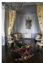
AnsRes.II, Schlafzimmer d. Gästeappartements (R. 20), Prunkwiege, DI024072, BSV-