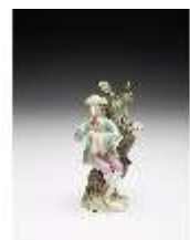
AnsRes.III,K, Klarinettenblasender Hirte, DI017316, BSV-