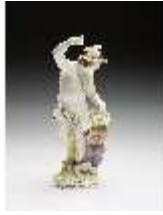
AnsRes.III,K, Merkur, DI016039, BSV-