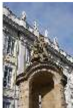
AnsRes.I, Wachhaus/Schilderhaus am Haupteingang, DI024123, BSV-