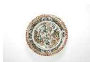
AnsRes.III,K, Teller, Inv. AnsRes.K1271, DI014400, BSV-