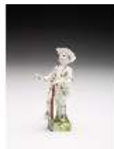
AnsRes.III,K, Gärtner, DI017329, BSV-