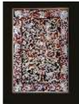
AnsRes.III,M, Spieltischplatte, M 111, DE001378, BSV-