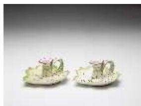
AnsRes.III,K, Handleuchtern, DI017345, BSV-