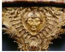
AnsRes.III,M,Konsoltisch mit einem axialen Bein, Kat.45, DE001439, BSV