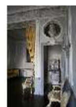
AnsRes.II, Schlafzimmer d. Gästearrappements (R. 20), DI024077, BSV-