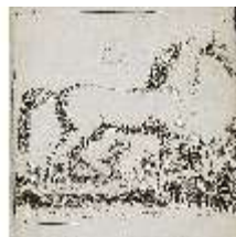
AnsRes.III,V, Der vollkommene Pferde-Kenner, DI015963, BSV-