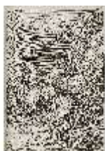
AnsRes.III,V, Der vollkommene Pferde-Kenner, DI015966, BSV-