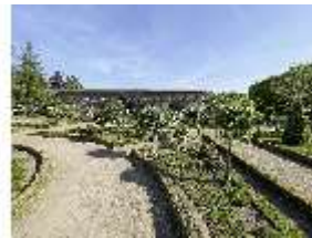
AnsRes.V, Leonhart-Fuchsgarten, DI022332, BSV-