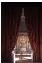
AnsRes.II, Orangerie, DE001939, BSV-