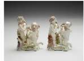
AnsRes.III,K, Winter, Puttengruppen, DI017352, BSV-