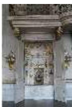
AnsRes.II, Schranknische, Festsaal (R. 2), DI024117, BSV-