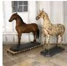
AnsRes.III,P, Pferdepräparate, DI018730, BSV-