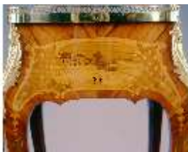
AnsRes.III,M, Ziertischchen "Table à Écrire", Inv. AnsRes.M0061, R.7, DE001425 BSV