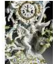
AnsRes.III,K, Phantasieformuhr, Inv.-Nr. AnsRes.K1241, DI012888, RSV-