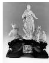
AnsRes.III,P, Allegorie d.Wohlstandes, DE003524, BSV-