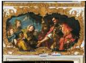
AnsRes.II, Audienzzimmer des Markgrafen, Supraporte, Hasdrubal, DE003211, BSV