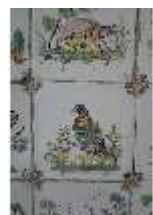
AnsRes.II, Fliese im Fliesensaal, R. 24, DI024091, BSV-