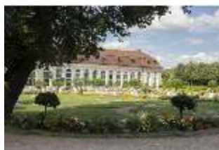
AnsRes.V, Orangerie und Parterre, DI005691, BSV