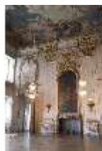
AnsRes.II, Festsaal (R. 2), DI013354, BSV-