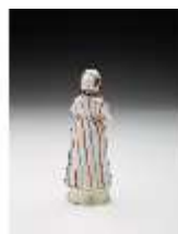
AnsRes.III,K, Tartarin, DI017321, BSV-