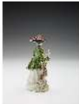
AnsRes.III,K, Jägerin, DI017314, BSV-