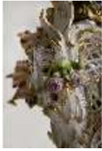
AnsRes.III,K, Kronleuchter (Detail); AnsRes.K0737, DI022256, BSV