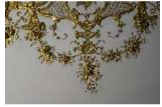
AnsRes.II, Audienzzimmer des Markgrafen, R. 5, Deckenstück, DI024006, BSV-