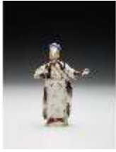
AnsRes.III,K, Pascha, DI017285, BSV-