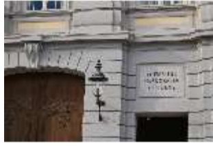
AnsRes.I, Residenz, Hauptfassade, Detail: Seitenportal, DI024130, BSV-