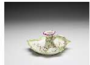
AnsRes.III,K, Handleuchter, DI017339, BSV-