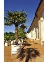
AnsRes.V, Hofgarten und Orangerie, DI000684, BSV