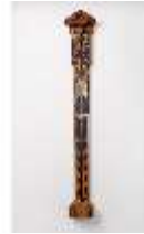
AnsRes.III,V,Barometer, Kat. 9, R.19, DE001422, BSV