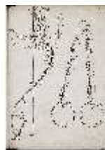
AnsRes.III,V, Der vollkommene Pferde-Kenner, DI015971, BSV-