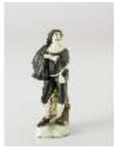
AnsRes.III,K, Scapin, K0554, DI016009, BSV-