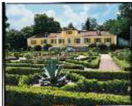
AnsRes.I, Rosengarten, Gartenmeisterhaus, DE001169, BSV-