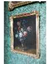
AnsRes.II, Bilderkabinett, R. 27, DI024106, BSV-