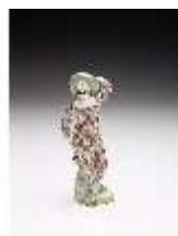
AnsRes.III,K, Harlekin, DI017306, BSV-