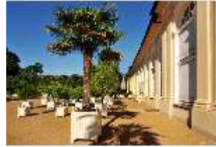
AnsRes.V, Hofgarten und Orangerie, DI000683, BSV