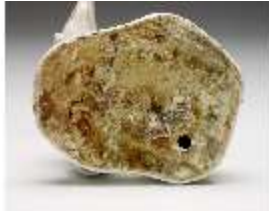
AnsRes.III,K, Meleager, DI017258, BSV-