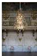
AnsRes.II, Festsaal (R. 2), DI013311, BSV-