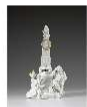
AnsRes.III,K, Erstes Gellert-Monument, Inv.-Nr. AnsRes.K1234, DI012878, RSV-