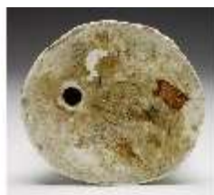
AnsRes.III,K, Einigkeit, DI017234, BSV-