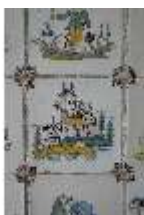
AnsRes.II, Fliese im Fliesensaal, R. 24, DI024054, BSV-