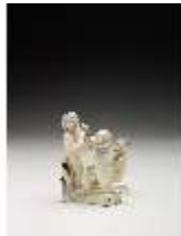
AnsRes.III,K, Winter, Puttengruppe, DI017220, BSV-