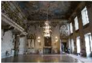
AnsRes.II, Festsaal, R. 2, DI024118, BSV-