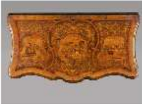
AnsRes.III,M,Konsoltisch,Tischplatte,R.5, DE001371, BSV-