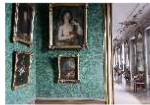
AnsRes.II, Bilderkabinett, R. 27, DI024105, BSV-