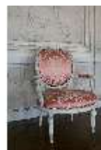
AnsRes.II, Sessel im Festsaal, R. 2, DI023961, BSV-