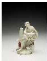
AnsRes.III,K, Apollo, DI017243, BSV-