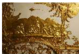
AnsRes.II, Schlafzimmer der Markgräfin, Deckenstück, DI023986, BSV-