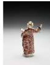
AnsRes.III,K, Pope, DI017289, BSV-