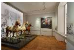
AnsRes.VII, Dauerausstellung Pferde, DI022322, BSV