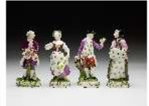
AnsRes.III,K, Folge der "Jahreszeiten", DI016180, BSV-