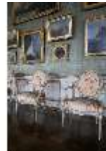
AnsRes.II, Galerie (R. 26), DI013350, BSV-