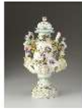
AnsRes.III,K, Balustervase, Inv.-Nr. AnsRes.K0708, DI012843, BSV-