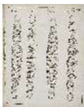
AnsRes.III,V, Der vollkommene Pferde-Kenner, DI015977, BSV-