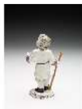
AnsRes.III,K, Knabe mit Hirtenstab, DI017300, BSV-