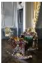
AnsRes.II, Schlafzimmer d. Gästeappartements (R. 20), Prunkwiege, DI024079, BSV-