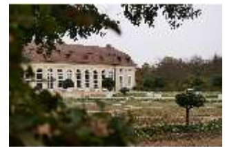
AnsRes.V, Blick auf die Orangerie, DI013955, BSV-