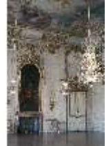
AnsRes.II, Festsaal, R. 2, DI023967, BSV-