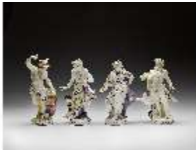
AnsRes.III,K, Serie "Antike Götter", DI016175, BSV-