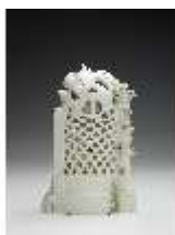
AnsRes.III,K, Liebespaar in der Laube, DI017224, BSV-