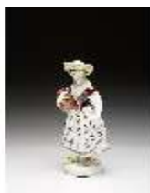
AnsRes.III,K, Gärtnerin, DI016073, BSV-