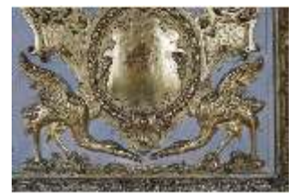
AnsRes.II, Marmorkabinett, R.8, Detail Dekoration, DI023999, BSV-