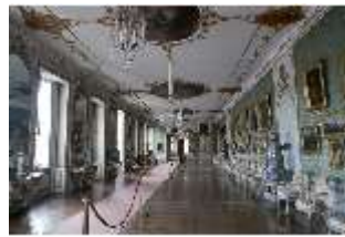
AnsRes.II, Galerie (R. 26), DI013349, BSV-