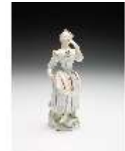
AnsRes.III,K, Tanzendes Mädchen, DI017259, BSV-