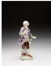
AnsRes.III,K, Gärtner, DI016078, BSV-