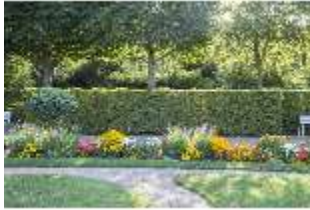
AnsRes.V, Parterre, Blumenrabatte, DI005679, BSV