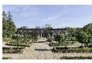
AnsRes.V, Leonhart-Fuchsgarten, DI022331, BSV-