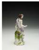
AnsRes.III,K, Venus, DI017252, BSV-