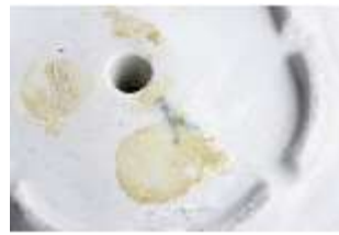
AnsRes.III,K, Girandole, K0745, DI016011, BSV-