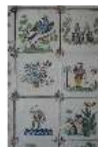
AnsRes.II, Fliesen im Fliesensaal, R. 24, DI023969, BSV-