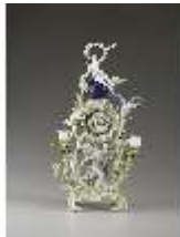
AnsRes.III,K, Phantasieformuhr, Inv.-Nr. AnsRes.K1241, DI012886, RSV-