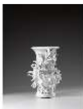
AnsRes.III,K, Stangenvase, Inv.-Nr. AnsRes.K0730, DI012869, BSV-