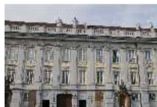
AnsRes.I, Residenz, Hauptfassade, DI024125, BSV-