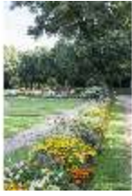
AnsRes.V, Parterre, Blumenrabatte, DI005709, BSV