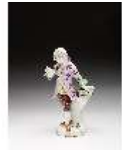
AnsRes.III,K, Gärtner, DI016080, BSV-