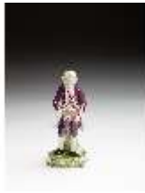
AnsRes.III,K, Kavalier mit Blumenkorb, DI016096, BSV-