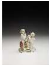
AnsRes.III,K, Winter, Puttengruppe, DI017217, BSV-