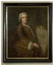
AnsRes.III,G, Hofarchitekt Leopold Retti; AnsRes.G0002, DI022294, BSV