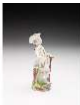
AnsRes.III,K, Gärtner, DI017332, BSV-