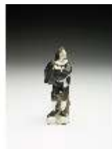
AnsRes.III,K, Scapin, DI017268, BSV-