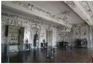
AnsRes.II, Fliesensaal, "Ordinäres Tafelzimmer", R. 24, DI024047, BSV-