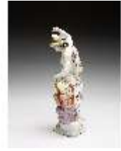
AnsRes.III,K, Merkur, DI016041, BSV-