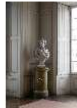
AnsRes.II, Zweites Vorzimmer des Markgrafen (R.4), Büste, DI024021, BSV-