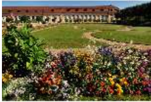
AnsRes.V, Hofgarten und Orangerie, DI000681, BSV