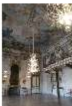
AnsRes.II, Festsaal (R. 2), DI013352, BSV-