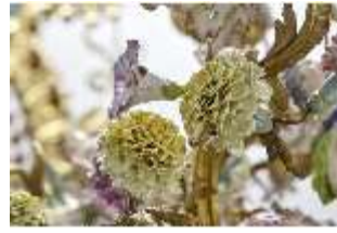
AnsRes.III,K, Kronleuchter (Detail); AnsRes.K0737, DI022258, BSV