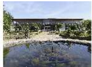
AnsRes.V, Leonhart-Fuchsgarten, DI022333, BSV-