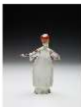
AnsRes.III,K, Pascha, DI017282, BSV-