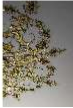
AnsRes.II, Audienzzimmer des Markgrafen, R. 5, Deckenstück, DI024008, BSV-