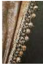
AnsRes.II, Schlafzimmer der Markgräfin, Vorhang (Det.), DI023984, BSV-