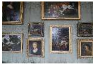
AnsRes.II, Galerie (R. 26), DI024099, BSV-