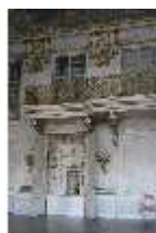
AnsRes.II, Festsaal (R. 2) mit Schranknische, DI024115, BSV-