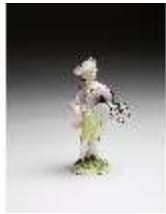
AnsRes.III,K, Trommler, DI016117, BSV-