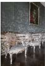
AnsRes.II, Audienzzimmer d. Gästeappartements (R. 21), DI024065, BSV-