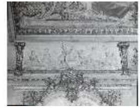
AnsRes.II, Relief "April...", R.2, DE003769, BSV-