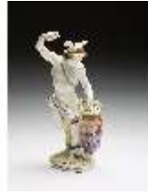
AnsRes.III,K, Merkur, DI016040, BSV-