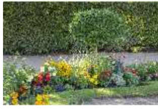
AnsRes.V, Parterre, Blumenrabatte, DI005643, BSV