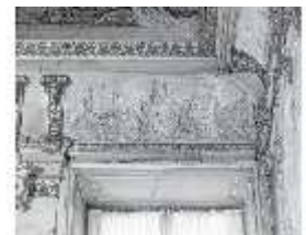
AnsRes.II, Relief "Mai...", R.2, DE003770, BSV-