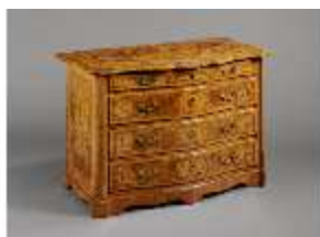
AnsRes.III,M, Kommode, Kat. 32, DE001442, BSV