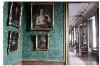
AnsRes.II, Bilderkabinett zwischen Festsaal und Galerie (R. 27), DI013351, BSV-