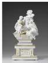
AnsRes.III,K, Drittes Gellert-Monument, Inv.-Nr. AnsRes.K1235, DI012880, RSV-