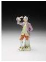
AnsRes.III,K, Kavalier, DI017265, BSV-