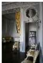
AnsRes.II, Schlafzimmer d. Gästeappartements (R. 20), DI024078, BSV-