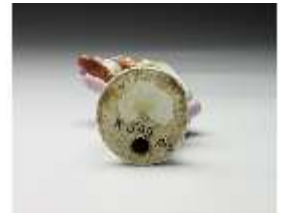
AnsRes.III,K, Kavalier, DI017267, BSV-