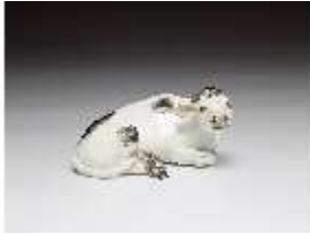
AnsRes.III,K, Liegender Stier, DI016141, BSV-