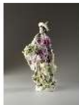
AnsRes.III,K, Malabarin, Inv.-Nr. AnsRes.K0524, DI012835, BSV-