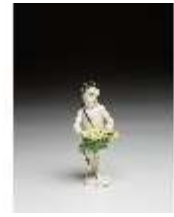
AnsRes.III,K, Putto mit Drehleier, DI016122, BSV-