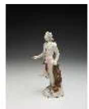
AnsRes.III,K, Meleager, DI017257, BSV-