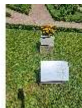
AnsRes.VII, Kräuterausstellung "Kräuterfarben" (2023), DI026683 BSV.