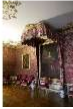
AnsRes.II, Audienzzimmer des Markgrafen, R. 5, DI013324, BSV-