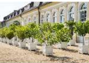
AnsRes.V, Orangerie mit Pflanzkübeln, DI005638, BSV