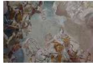
AnsRes.II, Festsaal, R. 2, Detail Deckengemälde, DI024111, BSV-