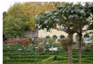
AnsRes.V, Heilkräutergarten im Herbst, DI013951, BSV-