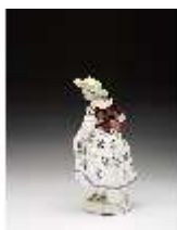
AnsRes.III,K, Gärtnerin, DI016074, BSV-