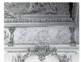
AnsRes.II, Relief "September...", R.2, DE003774, BSV-