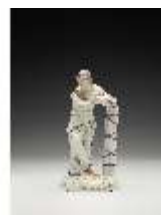
AnsRes.III,K, Einigkeit, DI017235, BSV-