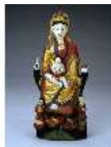
AnsRes.III,K, Göttin Guanyin, AnsRes.K196, DE003051, BSV-