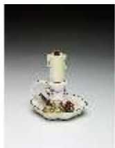
AnsRes.III,K, Standleuchter, DI016174, BSV-