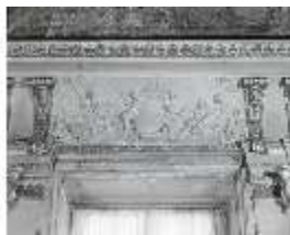
AnsRes.II, Relief "Juli...", R.2, DE003772, BSV-