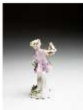
AnsRes.III,K, Knabe als Schnitter mit Sense, DI016057, BSV-