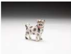
AnsRes.III,K, Mops, DI017325, BSV-