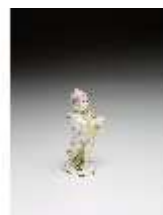
AnsRes.III,K, Putto als Maler, DI016132, BSV-