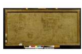
AnsRes.III, G, Tiergruppe, Rückseite, Samuel Beck, DI008279, BSV-