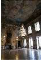
AnsRes.II, Festsaal, R. 2, DI024039, BSV-