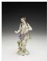
AnsRes.III,K, Venus, DI017250, BSV-