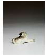
AnsRes.III,K, Kleiner liegender Mops, DI016151, BSV-