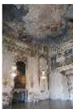
AnsRes.II, Festsaal (R. 2), DI013330, BSV-