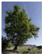
AnsRes.V, Hofgarten und Orangerie, Alteiche um 1800, DI022303, BSV