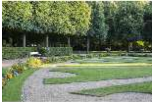
AnsRes.V, Parterre, Blumenrabatte und Sitzbank, DI005646, BSV