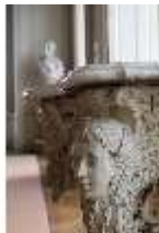
AnsRes.II, Zweites Vorzimmer des Markgrafen (R.4), Konsoltisch, DI024014, BSV-