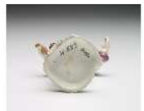
AnsRes.III,K, Knabe mit Hirtenstab, DI017301, BSV-