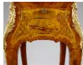
AnsRes.III,M,Ziertischchen "Table à Écrire", R.7, DE001428, BSV