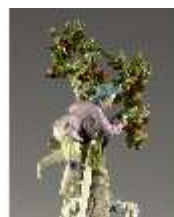
AnsRes.III,K, Kirschernte, Inv.- Nr. AnsRes.K0515, DI012833, BSV-