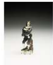
AnsRes.III,K, Scapin, DI017269, BSV-