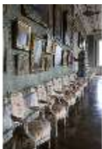
AnsRes.II, Galerie (R. 26), DI013334, BSV-