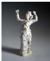
AnsRes.III, K, Tänzer, K 254, DE003043, BSV-