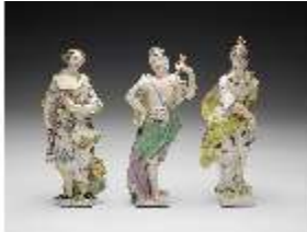
AnsRes.III,K, Europa, Amerika und Aurora, DI017342, BSV-