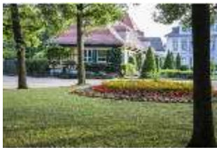
AnsRes.V, Blumenrabatten, DI005685, BSV