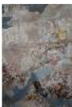
AnsRes.II, Festsaal (R. 2), Detail Deckengemälde, DI013331, BSV-