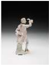
AnsRes.III,K, Kavalier, DI017295, BSV-