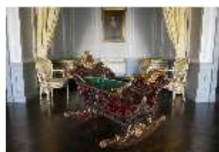
AnsRes.II, Schlafzimmer d. Gästeappartements (R. 20), Prunkwiege, DI024070, BSV-