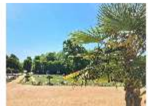
AnsRes.V, Palme im Hofgarten, DI019499, BSV