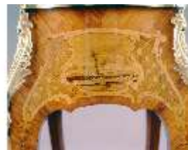
AnsRes.III,M, Ziertischchen "Table à Écrire", Inv. AnsRes.M0061, R.7, DE001426 BSV