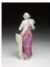
AnsRes.III,K, Ceres, DI016045, BSV-