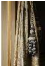
AnsRes.II, Schlafzimmer der Markgräfin, Vorhang (Det.), DI023983, BSV-