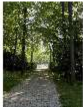
AnsRes.V, Hofgarten, Weg zum Parterre, DI022299, BSV