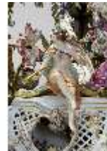
AnsRes.III,K, Kronleuchter (Detail); AnsRes.K0737, DI022267, BSV