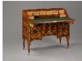
AnsRes.III,M,Pultsekretär, Kat.242, R.22, DE001421, BSV