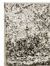
AnsRes.III,V, Der vollkommene Pferde-Kenner, DI015968, BSV-