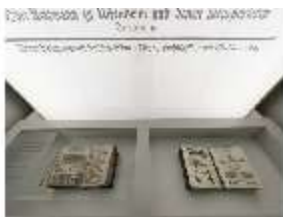
AnsRes.VII, Dauerausstellung Pferde, DI022325, BSV

Beschreibung Ansbach Residenz, Stand: Januar 2024