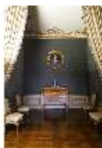
AnsRes.II, Schlafzimmer der Markgräfin (R. 9), DI013318, BSV-