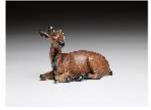
AnsRes.III,K, Liegender Hirsch, DI016173, BSV-