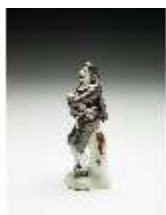
AnsRes.III,K, Scapin, DI017270, BSV-