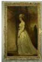
AnsRes.III,G, Lady Elisabeth Craven; AnsRes.G0022, DI022295, BSV