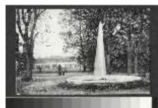
AnsRes.III,V, hist. Postkarte vom Hofgarten Ansbach, DI020355, BSV