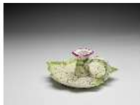
AnsRes.III,K, Handleuchter, DI017337, BSV-