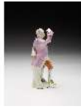
AnsRes.III,K, Kavalier, DI017266, BSV-