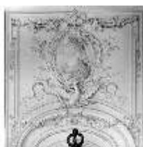
AnsRes.II, Vorzimmer d. Galerie, R. 25, DE003396, BSV-