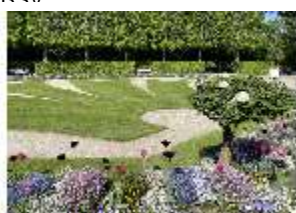
AnsRes.V, Hofgarten, Parterre mit Blumenrabatten, DI022307, BSV