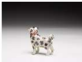
AnsRes.III,K, Mops, DI017326, BSV-