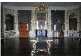
AnsRes.II, Audienzzimmer d. Gästeappartements (R. 21), DI024083, BSV-