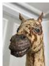
AnsRes.III,P, Pferdepräparat, DI018732, BSV-