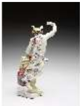
AnsRes.III,K, Merkur, DI016042, BSV-