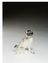
AnsRes.III,K, Mops auf Kissen, DI016160, BSV-