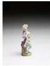
AnsRes.III,K, Kavalier mit Blumen, DI016060, BSV-