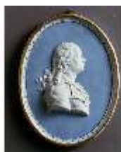
AnsRes.III,K, Porträtmedaillon Hardenberg, DE002852, BSV-