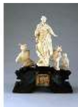
AnsRes.III,P, Allegorie d.Wohlstandes, DE003522, BSV-