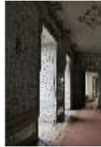
AnsRes.II, Fliesensaal, "Ordinäres Tafelzimmer", R. 24, DI024063, BSV-