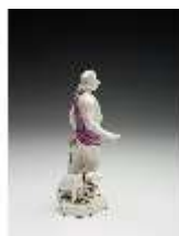
AnsRes.III,K, Meleager, DI017255, BSV-