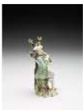
AnsRes.III,K, Klarinettenblasender Hirte, DI017317, BSV-