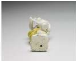
AnsRes.III,K, Putto mit Gießkanne, DI016130, BSV-