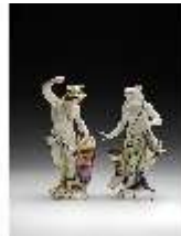
AnsRes.III,K, Serie "Antike Götter", Merkur und Venus, DI016176, BSV-