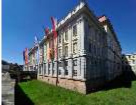
AnsRes.I, Residenz, Hauptfassade, Schrägansicht, DI000692, BSV