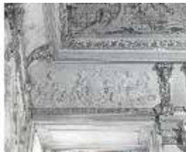
AnsRes.II, Relief "August...", R.2, DE003773, BSV-