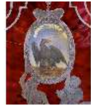
AnsRes.III,M, Paradowiege, Kat. 2, DE001446, BSV