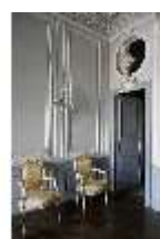
AnsRes.II, Schlafzimmer d. Gästearrappements (R. 20), DI024075, BSV-