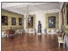
AnsRes.II, Familienzimmer R.22, DE003226, BSV-