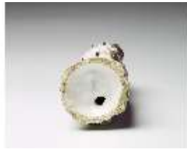
AnsRes.III,K, Dame mit Muff ("Winter"), DI016095, BSV-