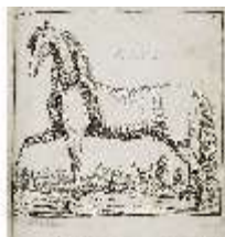
AnsRes.III,V, Der vollkommene Pferde-Kenner, DI015962, BSV-