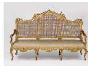
AnsRes.III,M, Kanapee "à la Reine", Kat.39, DE001447, BSV