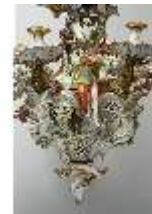
AnsRes.III,K, Kronleuchter (Detail); AnsRes.K0737, DI022271, BSV