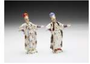
AnsRes.III,K, Paschas, DI017344, BSV-