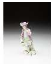
AnsRes.III,K, Knabe mit Blumen, DI016084, BSV-