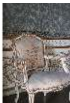
AnsRes.II, Audienzzimmer d. Gästeappartements (R. 21), DI024066, BSV-