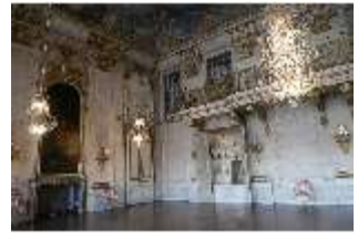
AnsRes.II, Festsaal, R. 2, DI024032, BSV-