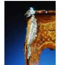
AnsRes.III,M, Ziertischchen "Table à Écrire", Inv. AnsRes.M0061, R.7, DE001423 BSV