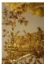
AnsRes.II, Schlafzimmer der Markgräfin, Deckenstück, DI023989, BSV-