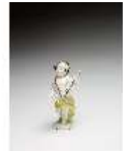
AnsRes.III,K, Putto mit Violine, DI016133, BSV-