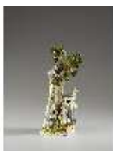
AnsRes.III,K, Kirschernte, Inv.- Nr. AnsRes.K0515, DI012832, BSV-