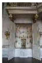
AnsRes.II, Festsaal (R. 2), Schranknische, DI013333, BSV-