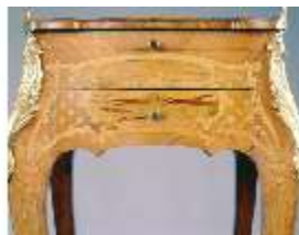
AnsRes.III,M, Ziertischchen "Table à Écrire", Inv. AnsRes.M0061, R.7, DE001424 BSV