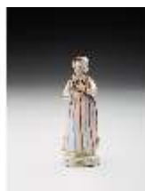
AnsRes.III,K, Tartarin, DI017320, BSV-