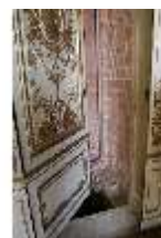
AnsRes.II, Schlafzimmer der Markgräfin, R. 9, DI023954, BSV-