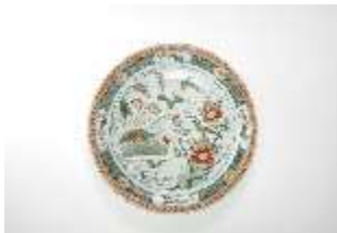
AnsRes.III,K, Platte, Inv. AnsRes.K1286, DI014398, BSV-