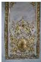
AnsRes.II, Marmorkabinett, R.8, Detail Dekoration, DI023997, BSV-