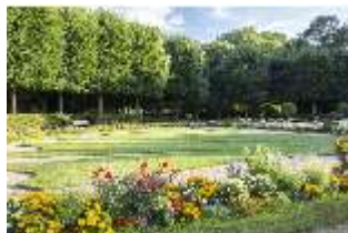
AnsRes.V, Parterre, Blumenrabatten und Sitzbänke, DI005682, BSV