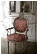
AnsRes.II, Zweites Vorzimmer des Markgrafen (R.4), Armsessel, DI024022, BSV-