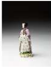
AnsRes.III,K, Dame mit Muff ("Winter"), DI016094, BSV-