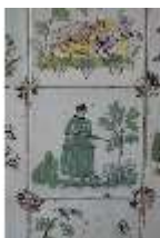
AnsRes.II, Fliese im Fliesensaal, R. 24, DI024058, BSV-