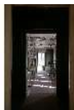
AnsRes.II, Blick vom Festsaal in die Galerie, R. 26, DI023962, BSV-