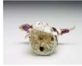
AnsRes.III,K, Pascha, DI017287, BSV-