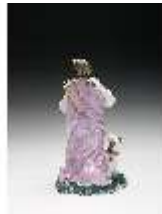
AnsRes.III,K, Diana, DI016048, BSV-