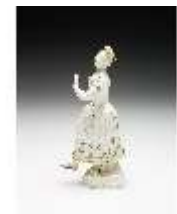
AnsRes.III,K, Tanzendes Mädchen, DI017263, BSV-