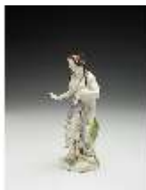
AnsRes.III,K, Venus, DI017251, BSV-