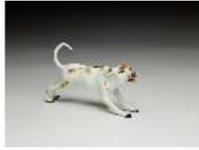
AnsRes.III,K, Windhund, DI016164, BSV-