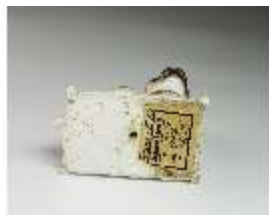
AnsRes.III,K, Mops auf Kissen, DI016162, BSV-