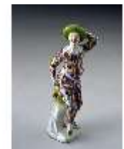
AnsRes.III, K, Harlekin, K 239, DE003048, BSV-