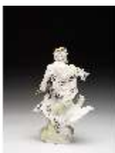
AnsRes.III,K, Jupiter, DI016069, BSV-