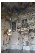
AnsRes.II, Festsaal (R. 2) mit Schranknische, DI024113, BSV-