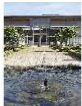
AnsRes.V, Leonhart-Fuchsgarten, DI022334, BSV-