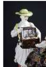
AnsRes.III,K, Gruppe "Der Herzdosenkauf", Inv.-Nr. AnsRes.K0502, DI012822, BSV-