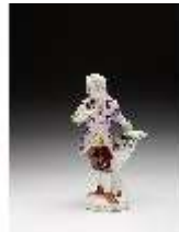
AnsRes.III,K, Gärtner, DI016079, BSV-