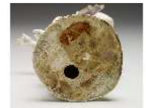
AnsRes.III,K, Venus, DI017253, BSV-