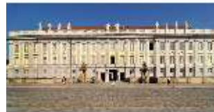
AnsRes.I, Residenz, Hauptfassade, DI000694, BSV