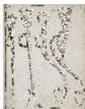
AnsRes.III,V, Der vollkommene Pferde-Kenner, DI015978, BSV-