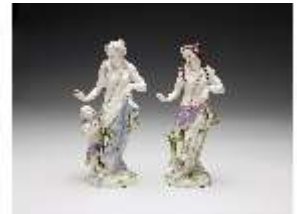
AnsRes.III,K, Venus, DI017351, BSV-