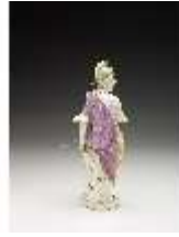
AnsRes.III,K, Europa, DI017227, BSV-