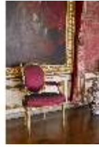
AnsRes.II, Audienzzimmer des Markgrafen, R. 5, DI024005, BSV-