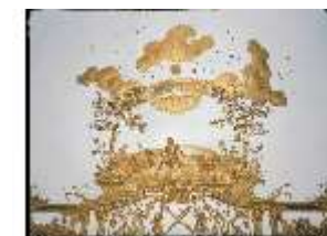
AnsRes.II, Schlafzimmer der Markgräfin R.9, Deckenstück, DE003215, BSV-