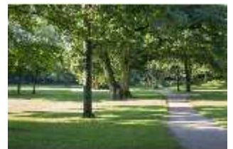
AnsRes.V, Parterre, Eiche, DI005653, BSV