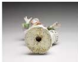
AnsRes.III,K, Gärtner, DI016082, BSV-