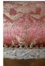
AnsRes.II, Zweites Vorzimmer des Markgrafen (R.4), Armsessel, DI024027, BSV-