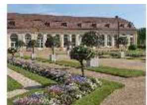
AnsRes.V, Hofgarten, Orangerie mit Parterre, DI022302, BSV