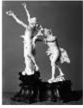
AnsRes.III, P, Apollo und Daphne, R.7, DE003526, BSV-