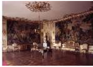
AnsRes.II, R14, Gobelinzimmer, DE003389, BSV-