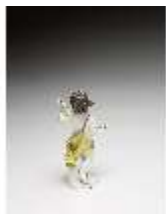
AnsRes.III,K, Putto mit Violine, DI016134, BSV-