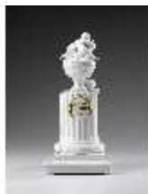
AnsRes.III,K, Zweites Gellert-Monument, Inv.-Nr. AnsRes.K1233, DI012876, RSV.