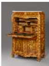
AnsRes.III,M,Schreibschrank "Secrétaire à abattant", Kat.79, DE001437, BSV