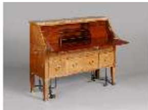
AnsRes.III,M, Pultschreibtisch, Kat.89, DE001449, BSV