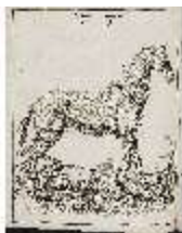
AnsRes.III,V, Der vollkommene Pferde-Kenner, DI015961, BSV-