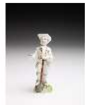
AnsRes.III,K, Gärtner, DI017330, BSV-