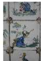
AnsRes.II, Fliese im Fliesensaal, R. 24, DI024052, BSV-