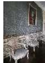
AnsRes.II, Audienzzimmer d. Gästeappartements (R. 21), DI024064, BSV-