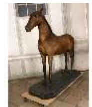
AnsRes.III,P, Pferdepräparat, DI018743, BSV-