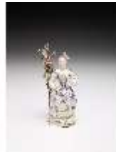
AnsRes.III,K, Mädchen mit Notenblatt, DI017302, BSV-