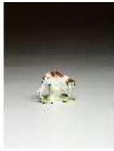
AnsRes.III,K, Jagdhund, DI016158, BSV-