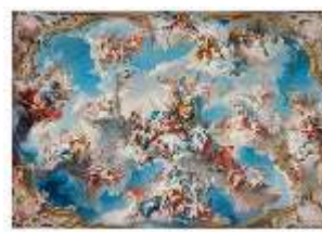
AnsRes.III,G, R1, Entwurf Friederike Caroline, DE000006, BSV-