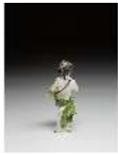
AnsRes.III,K, Putto mit Drehleier, DI016123, BSV-