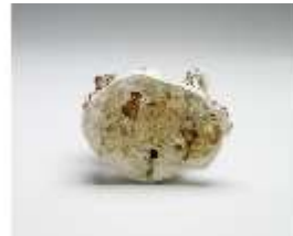
AnsRes.III,K, Jägerin, DI017315, BSV-