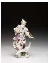
AnsRes.III,K, Juno, DI016065, BSV-