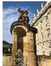
AnsRes.I, Wachhaus/Schilderhaus am Haupteingang, DI021344, BSV-