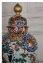
AnsRes.III,K, Japanische Deckelvase, AnsRes.K0695, DI024024, BSV-