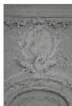
AnsRes.II, Stucksupaporte Wilhelm Friedrich, R. 25, DI024092, BSV-