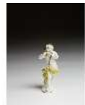
AnsRes.III,K, Putto mit Waldhorn, DI016120, BSV-