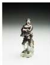
AnsRes.III,K, Scapin, DI017271, BSV-