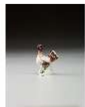
AnsRes.III,K, Kleine Henne, DI016144, BSV-