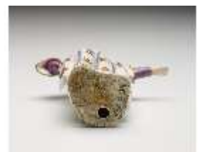
AnsRes.III,K, Pascha, DI017284, BSV-