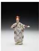
AnsRes.III,K, Pascha, DI017281, BSV-