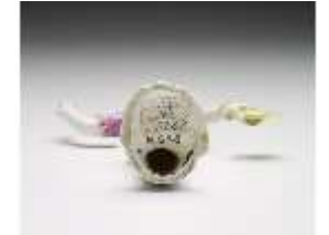
AnsRes.III,K, Tanzender Kavaliere, DI017336, BSV-