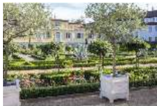
AnsRes.V, Parterre, Gärtnerwohngebäude im Heilkräutergarten, DI005710, BSV