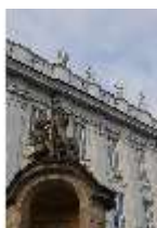
AnsRes.I, Residenz, Hauptfassade m. Wachhaus/Schilderhaus, DI024128, BSV-