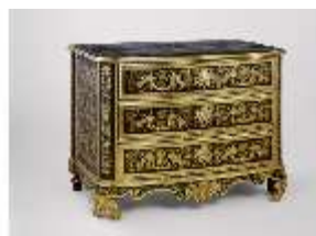
AnsRes.III,M, Kommode, Kat.5, DE001444, BSV