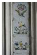
AnsRes.II, Fliesen im Fliesensaal, R. 24, DI023976, BSV-