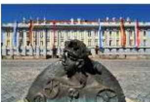
AnsRes.I, Residenz, Hauptfassade, DI000706, BSV