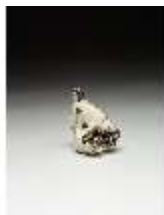
AnsRes.III,K, Zwei kämpfende Möpse, DI016156, BSV-