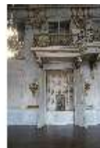
AnsRes.II, Schranknische, Festsaal (R. 2), DI024116, BSV-