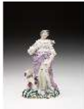
AnsRes.III,K, Diana, DI016047, BSV-