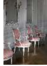
AnsRes.II, Zweites Vorzimmer des Markgrafen (R.4), DI024010, BSV-