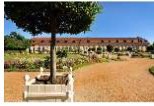
AnsRes.V, Hofgarten und Orangerie, DI000678, BSV