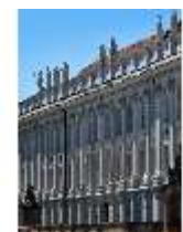
AnsRes.I, Residenz, Hauptfassade, Detail, DI000704, BSV