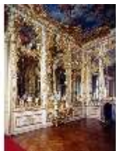
AnsRes.II, Spiegelkabinett (R.10), DE001460, BSV-