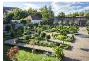
AnsRes.V, Heilkräutergarten mit Citrushaus, DI005706, BSV