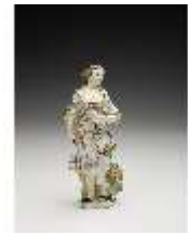
AnsRes.III,K, Aurora, DI017239, BSV-