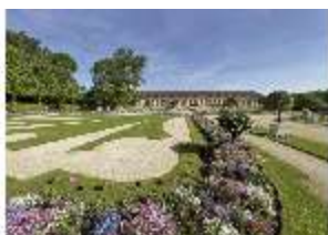
AnsRes.V, Hofgarten, Orangerie mit Blumenrabatten, DI022304, RSV