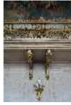
AnsRes.II, Festsaal, R. 2, DI023959, BSV-