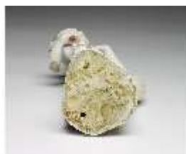
AnsRes.III,K, Ceres, DI016046, BSV-