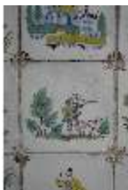
AnsRes.II, Fliese im Fliesensaal, R. 24, DI024049, BSV-