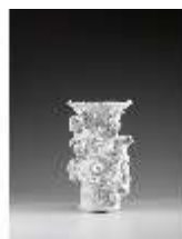
AnsRes.III,K, Stangenvase, Inv.-Nr. AnsRes.K0731, DI012870, BSV-