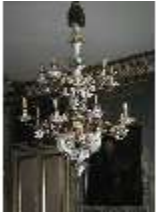
AnsRes.III,B, Porzellan-Kronleuchter, DE001940, BSV-