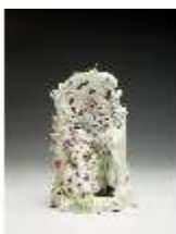
AnsRes.III,K, Liebespaar in der Laube, DI017223, BSV-