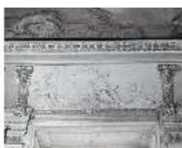
AnsRes.II, Relief "Wasser", R.2, DE003780, BSV-