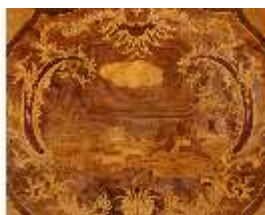
AnsRes.III,M, Kommode, Kat. 32, DE001443, BSV