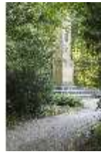
AnsRes.V, Johann-Peter-Uz-Denkmal, DI005657, BSV