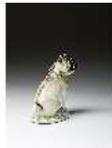
AnsRes.III,K, Größerer Mops, DI016170, BSV-