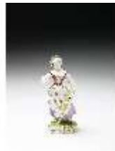
AnsRes.III,K, Schnitterin (Sommer), DI016058, BSV-