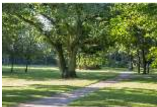
AnsRes.V, Parterre, Eiche, DI005654, BSV