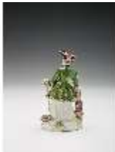
AnsRes.III,K, Jägerin, DI017313, BSV-