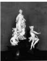
AnsRes.III,P, Allegorie des Wohlstandes, R7, DE003523, BSV-