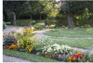
AnsRes.V, Parterre, Blumenrabatte, DI005701, BSV