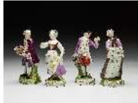
AnsRes.III,K, Folge der "Jahreszeiten", DI016178, BSV-