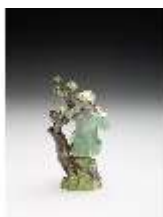
AnsRes.III,K, Klarinettenblasender Hirte, DI017318, BSV-