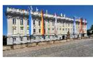
AnsRes.I, Residenz, Hauptfassade, Schrägansicht, DI000689, BSV