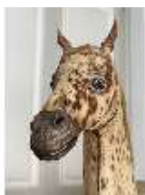
AnsRes.III,P, Pferdepräparat, DI018731, BSV-