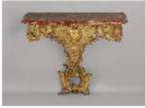
AnsRes.III,M,Konsoltisch mit einem axialen Bein, Kat.45, DE001438, BSV