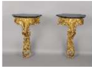
AnsRes.III,M, Paar einbeinige Eckkonsoltische, Kat.67, DE001441, BSV