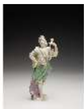
AnsRes.III,K, Amerika, DI017229, BSV-