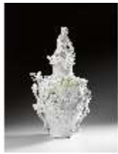
AnsRes.III,K, Apollovase, Inv.- Nr. AnsRes.K0727, DI012866, BSV-