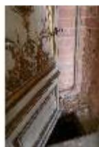
AnsRes.II, Schlafzimmer der Markgräfin, R. 9, DI023953, BSV-