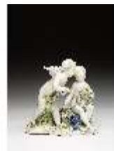
AnsRes.III,K, Zwei Putti mit Blumengirlanden, DI016034, BSV-