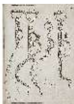
AnsRes.III,V, Der vollkommene Pferde-Kenner, DI015979, BSV-