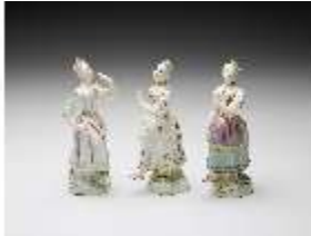
AnsRes.III,K, Tanzende Mädchen, DI017350, BSV-