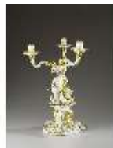
AnsRes.III,K, Standleuchter, Inv.-Nr. AnsRes.K0738, DI012872, BSV-