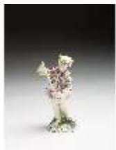
AnsRes.III,K, Knabe als Schnitter mit Sense, DI016056, BSV-