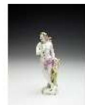
AnsRes.III,K, Apollo, DI017246, BSV-