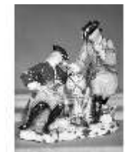
AnsRes.III,K, "Freimaurer mit Globus", DE000493, BSV-