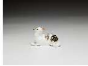
AnsRes.III,K, Liegendes Schaf, DI016147, BSV-