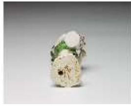
AnsRes.III,K, Putto als Trommler, DI016138, BSV-