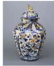
AnsRes.III,K, Deckelvase (1:3), Japan, K 711, DE000740, BSV-