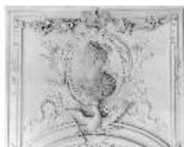
AnsRes.II, Vorzimmer d. Galerie, R. 25, DE003395, BSV-