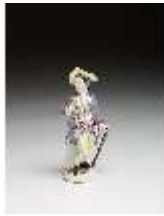
AnsRes.III,K, Knabe als Kavalier mit Blumen, DI016108, BSV-