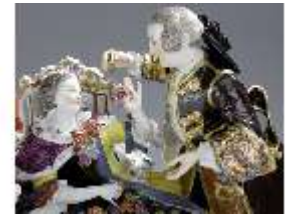
AnsRes.III,K, Gruppe "Der Herzdosenkauf", Inv.-Nr. AnsRes.K0502, DI012823, BSV-