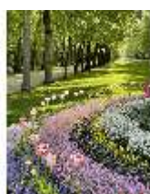
AnsRes.V, Hofgarten, Vierreihige Lindenallee, DI022314, BSV