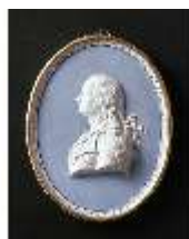
AnsRes.III,K, Porträtmedaillon Hardenberg, Carl August Weidel, Got. Halle, DE003042, RSV