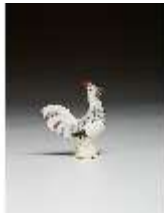
AnsRes.III,K, Kleiner Hahn, DI016145, BSV-