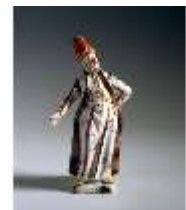
AnsRes.III, K, Würdenträger, K 251, DE003057, BSV-