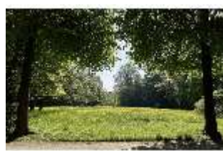
AnsRes.V, Hofgarten, Jägerwiese, DI022309, BSV