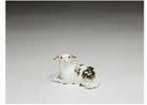
AnsRes.III,K, Liegendes Schaf, DI016148, BSV-