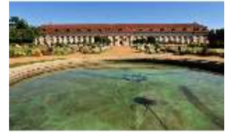
AnsRes.V, Hofgarten und Orangerie, DI000680, BSV