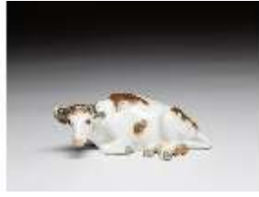
AnsRes.III,K, Liegende Kuh, DI016139, BSV-