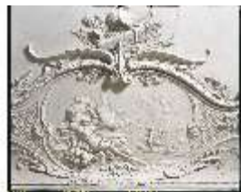
AnsRes.II, Zweites Vorzimmer des Markgrafen (R.4), Prometheus und der Adler, DE003219, BSV