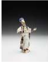
AnsRes.III,K, Pascha, DI017286, BSV-