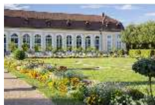
AnsRes.V, Orangerie und Parterre, DI005681, BSV