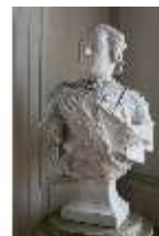
AnsRes.III,P, Büste Carl Wilhelm Friedrich, AnsRes.P0010, DI024016, RSV-