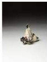
AnsRes.III,K, Zwei kämpfende Möpse, DI016157, BSV-