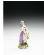
AnsRes.III,K, Schnitterin (Sommer), DI016059, BSV-