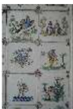
AnsRes.II, Fliesen im Fliesensaal, R. 24, DI023974, BSV-