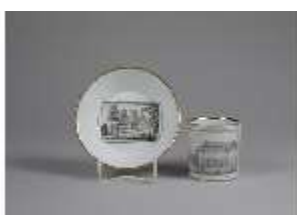
AnsRes.III,K, Tasse mit Untertasse, AnsRes.K0496, DI022249, BSV