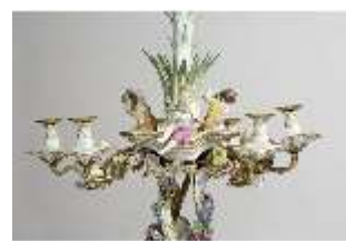
AnsRes.III,K, Kronleuchter (Detail); AnsRes.K0737, DI022254, BSV