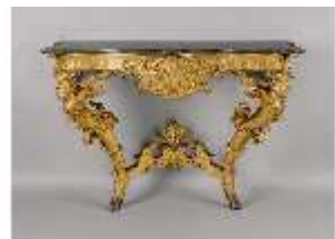
AnsRes.III,M,Konsoltisch (von einem Paar), Kat. 11, Galerie, R.26, DE001423, BSV