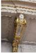
AnsRes.II, Festsaal, R. 2, DI024036, BSV-