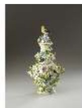
AnsRes.III,K, Potpourrivase, Inv.-Nr. AnsRes.K0706, DI012841, BSV-