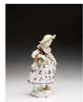
AnsRes.III,K, Gärtnerin, DI016076, BSV-