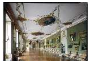
AnsRes.II, Galerie, R.26, DE001458, BSV-