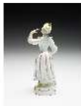
AnsRes.III,K, Tanzendes Mädchen, DI017261, BSV-