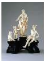
AnsRes.III,P, Allegorie d.Wohlstandes, DE003521, BSV-