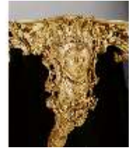
AnsRes.III,M,Konsoltisch, Kat.49, R.14, DE001430, BSV