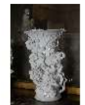
AnsRes.III,K, Stangenvase, Inv.-Nr. AnsRes.K0731, DI024086, BSV-