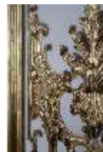
AnsRes.II, Marmorkabinett, R.8, Detail, DI024002, BSV-