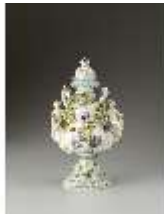
AnsRes.III,K, Vase, Inv.-Nr. AnsRes.K0709, DI012844, BSV-