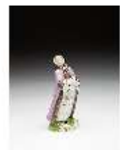
AnsRes.III,K, Dame mit Muff ("Winter"), DI016093, BSV-