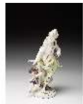
AnsRes.III,K, Venus mit Amor, DI016111, BSV-