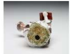
AnsRes.III,K, Pope, DI017290, BSV-