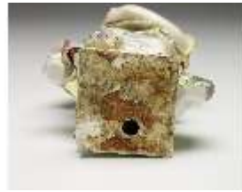
AnsRes.III,K, Aurora, DI017241, BSV-