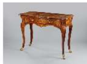
AnsRes.III,M, Konsoltisch, schräg, R.5, DE001379, BSV-