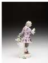
AnsRes.III,K, Gärtner, DI016081, BSV-