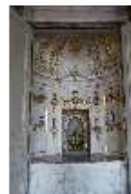
AnsRes.II, Schranknische, Festsaal (R. 2), DI024033, BSV-