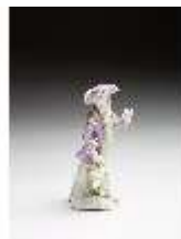
AnsRes.III,K, Knabe mit Blumen, DI016083, BSV-