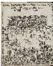
AnsRes.III,V, Der vollkommene Pferde-Kenner, DI015955, BSV-