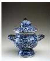
AnsRes.III, K, Deckelterrine, K 60, DE003044, BSV-