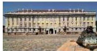
AnsRes.I, Residenz, Hauptfassade, DI000698, BSV