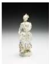
AnsRes.III,K, Tanzendes Mädchen, DI017264, BSV-