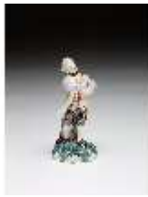
AnsRes.III,K, Kavalier mit Becher, DI016055, BSV-