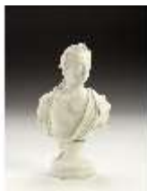
AnsRes.III,K, Büste Kaiser Joseph II., AnsRes.K1232, DI022695, BSV-