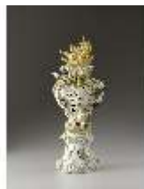
AnsRes.III,K, Ziervase "Feuer", Inv.-Nr. AnsRes.K0719, DI012864, BSV-