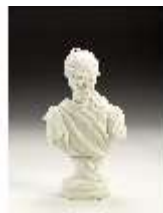
AnsRes.III,K, Büste Kaiser Joseph II., AnsRes.K1232, DI022696, BSV-