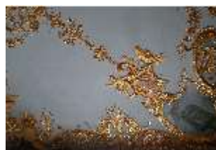
AnsRes.II, Schlafzimmer d. Markgrafen, R.6, Decke, DI024003, BSV-