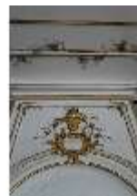
AnsRes.II, Galerie (R. 26), Detail Wanddekoration, DI024095, BSV-