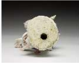
AnsRes.III,K, Venus mit Amor, DI016116, BSV-