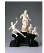
AnsRes.III,P, Allegorie des Friedens, DE003519, BSV-