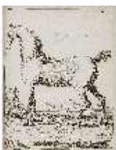
AnsRes.III,V, Der vollkommene Pferde-Kenner, DI015958, BSV-