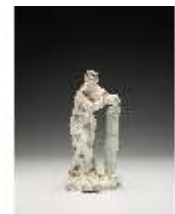
AnsRes.III,K, Einigkeit, DI017232, BSV-