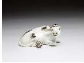
AnsRes.III,K, Liegender Stier, DI016142, BSV-