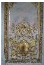
AnsRes.II, Marmorkabinett, R.8, Detail Dekoration, DI023996, BSV-