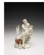
AnsRes.III,K, Apollo, DI017242, BSV-