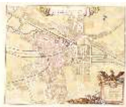
AnsRes.IV, Stadtplan Ansbach, Tietzmann, 1743/1755, DE001942, BSV