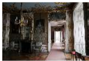
AnsRes.II, Enfilade, DI013320, BSV-