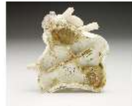
AnsRes.III,K, Winter, Puttengruppe, DI017222, BSV-