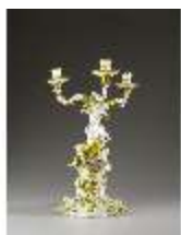
AnsRes.III,K, Standleuchter, Inv.-Nr. AnsRes.K0738, DI012874, BSV-