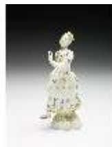
AnsRes.III,K, Tanzendes Mädchen, DI017262, BSV-