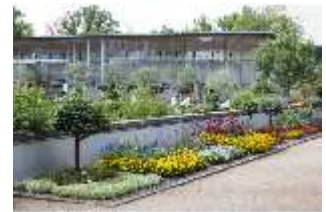
AnsRes.V, Heilkräutergarten mit Citrushaus, DI005688, BSV