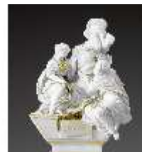
AnsRes.III,K, Drittes Gellert-Monument, Inv.-Nr. AnsRes.K1235, DI012881, RSV-