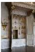
AnsRes.II, Festsaal (R. 2), Schranknische, DI013356, BSV-