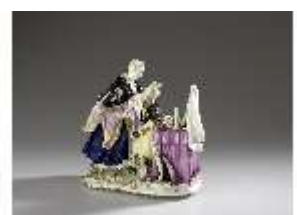
AnsRes.III,K, Toilette der Prinzessin, Inv.-Nr. AnsRes.K0512, DI012829, RSV-