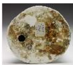
AnsRes.III,K, Einigkeit, DI017237, BSV-