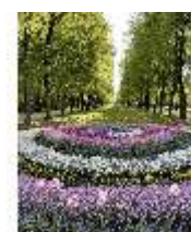
AnsRes.V, Hofgarten, Vierreihige Lindenallee, DI022316, BSV