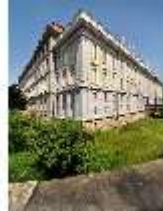
AnsRes.I, Residenz, Schrägansicht von Süden, DI000700, BSV