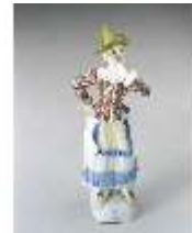
AnsRes.III, K, Colombine, K 240, DE003049, BSV-