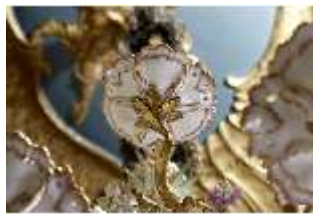
AnsRes.III,K, Kronleuchter (Detail); AnsRes.K0737, DI022269, BSV