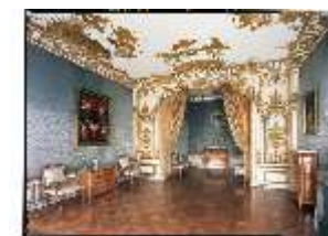
AnsRes.II, Schlafzimmer der Markgräfin R.9, DE001461, BSV-