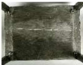
AnsRes.III,M, Ziertischchen "Table à Écrire", Inv. AnsRes.M0061, R.7, DE001428 BSV