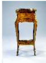
AnsRes.III,M, Ziertischchen "Table à Écrire", Inv. AnsRes.M0061, R.7, DE001422 BSV