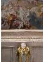
AnsRes.II, Festsaal, R. 2, DI024108, BSV-