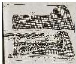
AnsRes.III,V, Der vollkommene Pferde-Kenner, DI015970, BSV-