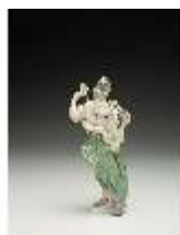
AnsRes.III,K, Amerika, DI017230, BSV-