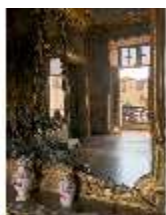
AnsRes.II, Spiegelkabinett im Appartement der Markgräfin, DI021347, BSV-