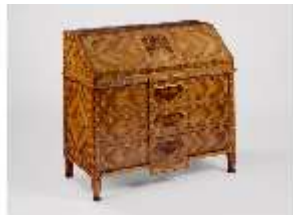
AnsRes.III,M, Schreibkommode, Kat.114, DE001451, BSV