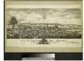
AnsRes.III,G, Historische Ansicht der Stadt Ansbach, DI022699, BSV