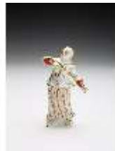
AnsRes.III,K, Türkin mit Kopftuch, DI017296, BSV-