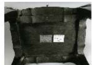
AnsRes.III,M, Ziertischchen "Table à Écrire", Inv. AnsRes.M0061, R.7, DE001427 BSV