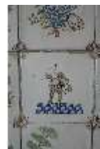
AnsRes.II, Fliese im Fliesensaal, R. 24, DI024060, BSV-