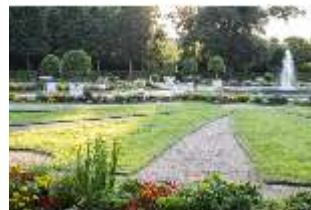
AnsRes.V, Parterre, Blumenrabatten und Springbrunnen, DI005647, BSV