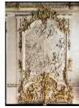
AnsRes.II, R2, Festsaal, Relief, DE001188, BSV-