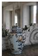
AnsRes.III,K, Japanische Deckelvase, AnsRes.K0701, DI024025, BSV-