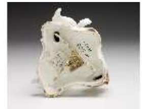
AnsRes.III,K, Winter, Puttengruppe, DI017219, BSV-