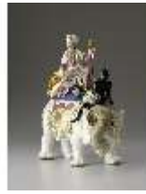
AnsRes.III,K, Sultan auf Elefant, Inv.-Nr. AnsRes.K0504, DI012828, RSV-