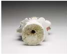
AnsRes.III,K, Gärtnerin, DI016077, BSV-