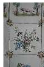
AnsRes.II, Fliese im Fliesensaal, R. 24, DI024056, BSV-