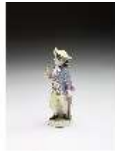
AnsRes.III,K, Knabe als Kavalier mit Blumen, DI016109, BSV-