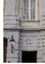
AnsRes.I, Residenz, Hauptfassade, Detail: Seitenportal, DI024132, BSV-