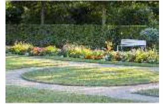
AnsRes.V, Parterre, Blumenrabatte und Sitzbank, DI005644, BSV