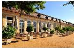
AnsRes.I, Orangerie mit Parterre, DI000672, BSV