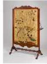
AnsRes.III,M,Ofenschirm, Kat.92, R.16, DE001431, BSV