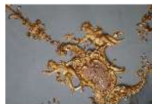
AnsRes.II, Schlafzimmer d. Markgrafen, R.6, Decke, DI024004, BSV-