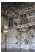
AnsRes.II, Festsaal (R. 2) mit Schranknische, DI024114, BSV-