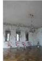
AnsRes.II, Zweites Vorzimmer des Markgrafen (R.4), DI024017, BSV-