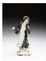
AnsRes.III,K, Heilige Therese, DI016102, BSV-