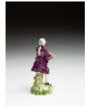
AnsRes.III,K, Kavalier mit Blumenkorb, DI016098, BSV-