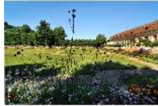
AnsRes.V, Hofgarten und Orangerie, DI000682, BSV