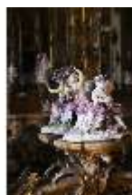
AnsRes.II, Spiegelkabinett im Appartement der Markgräfin (R. 10), DI013313, BSV-