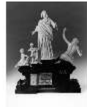
AnsRes.III,P, Allegorie d.Wohlstandes, DE003529, BSV-