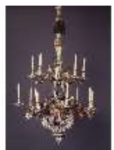
AnsRes.III,K, Porzellan- Kronleuchter K 737, DE001941, BSV-