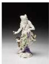
AnsRes.III,K, Venus mit Amor, DI016112, BSV-