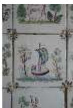
AnsRes.II, Fliese im Fliesensaal, R. 24, DI024057, BSV-