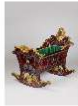
AnsRes.III,M, Paradowiege, Kat. 2, DE001445, BSV