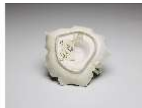
AnsRes.III,K, Handleuchter, DI017338, BSV-