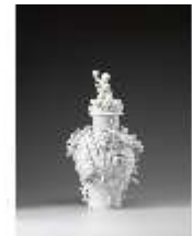
AnsRes.III,K, Deckelvase, Inv.-Nr. AnsRes.K0729, DI012868, BSV-