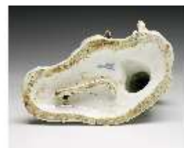
AnsRes.III,K, Zwei Putti mit Blumengirlanden, DI016038, BSV-