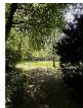
AnsRes.V, Hofgarten, DI022308, BSV