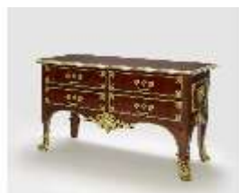
AnsRes.III,M, Kommode, Inv.-Nr.: AnsRes.M0004, DI025722, BSV