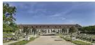
AnsRes.V, Hofgarten und Orangerie mit Blumenrabatten, DI022306, RSV