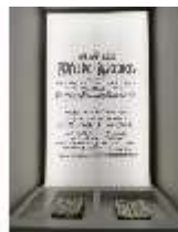
AnsRes.VII, Dauerausstellung Pferde, DI022323, BSV