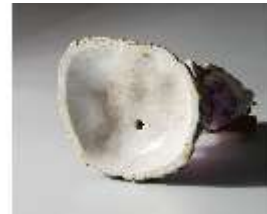
AnsRes.III,K, Diana, DI016049, BSV-