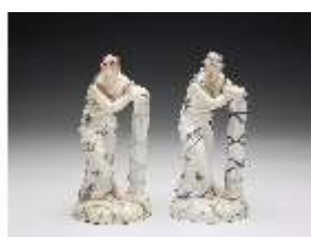
AnsRes.III,K, Einigkeit, DI017343, BSV-