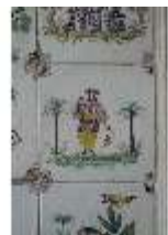
AnsRes.II, Fliese im Fliesensaal, R. 24, DI023970, BSV-