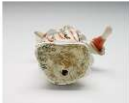
AnsRes.III,K, Türkin mit Kopftuch, DI017298, BSV-