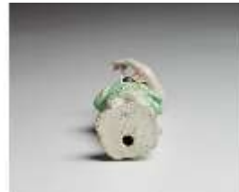
AnsRes.III,K, Putto mit Triangel, DI016127, BSV-