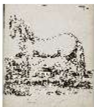
AnsRes.III,V, Der vollkommene Pferde-Kenner, DI015957, BSV-