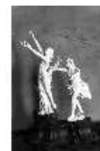
AnsRes.III, P, Apollo und Daphne, R.7, DE003525, BSV-