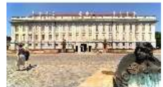
AnsRes.I, Residenz, Hauptfassade, DI000696, BSV