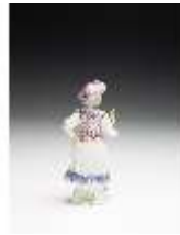
AnsRes.III,K, Schäferin, DI017292, BSV-