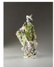
AnsRes.III,K, Malabarin, Inv.-Nr. AnsRes.K0526, DI012838, BSV-