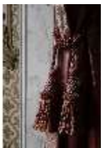
AnsRes.II, Marmorkabinett, R.8, Det. Vorhang, DI023994, BSV-