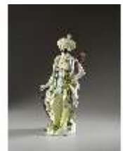
AnsRes.III,K, Malabare, Inv.-Nr. AnsRes.K0525, DI012836, BSV-