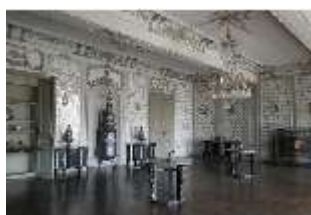
AnsRes.II, Fliesensaal, "Ordinäres Tafelzimmer" R. 24, DI013338, BSV-