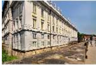
AnsRes.I, Residenz, Hauptfassade, Schrägansicht, DI000702, BSV