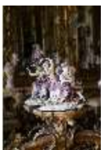
AnsRes.III,K, Kindergruppe "Lotterie", AnsRes.K0516, DI023977, BSV-