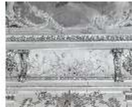
AnsRes.II, Relief "Frieden", R.2, DE003781, BSV-