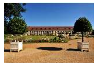
AnsRes.V, Hofgarten und Orangerie, DI000676, BSV