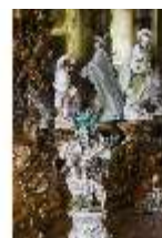
AnsRes.II, Vier Porzellanfiguren im Spiegelkabinett, DI023978, BSV-