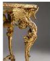
AnsRes.III,M,Tisch mit Drachenbeinen, Kat.6, R.21, DE001434, BSV