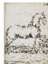
AnsRes.III,V, Der vollkommene Pferde-Kenner, DI015959, BSV-