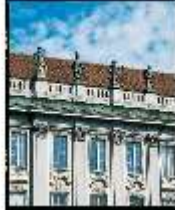
AnsRes.I, Hauptfassade, Detail, DE003200, BSV