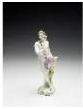
AnsRes.III,K, Apollo, DI017247, BSV-