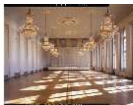
AnsRes.II, Orangerie, Blauer Saal, DE001092, BSV-