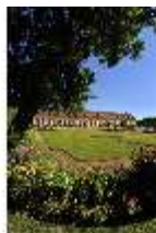
AnsRes.V, Hofgarten, DI000674, BSV