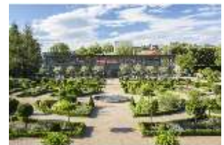
AnsRes.V, Heilkräutergarten mit Citrushaus, DI005708, BSV