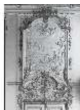
AnsRes.II, Supraportenrelief/Ost, R.2, DE003765, BSV-