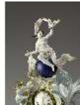
AnsRes.III,K, Phantasieformuhr, Inv.-Nr. AnsRes.K1241, DI012887, RSV-