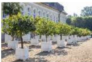
AnsRes.V, Pflanzkübel vor der Orangerie, DI005661, BSV