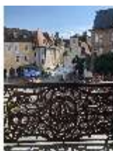
AnsRes.II, Blick aus dem Spiegelkabinett auf den Platz, DI021345, BSV-