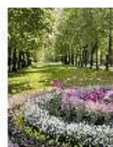
AnsRes.V, Hofgarten, Vierreihige Lindenallee, DI022315, BSV