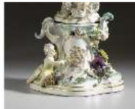
AnsRes.III,K, Phantasieformuhr, Inv.-Nr. AnsRes.K1240, DI012883, RSV-