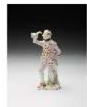
AnsRes.III,K, Kavalier, DI017294, BSV-