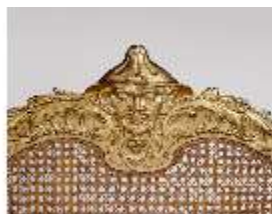
AnsRes.III,M, Kanapee "à la Reine", Kat.39, DE001448, BSV