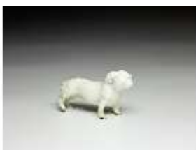
AnsRes.III,K, Stehender Dachshund, DI016166, BSV-