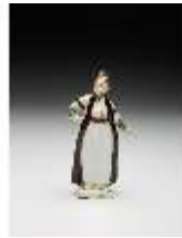
AnsRes.III,K, Türke mit Pelzmantel, DI017277, BSV-