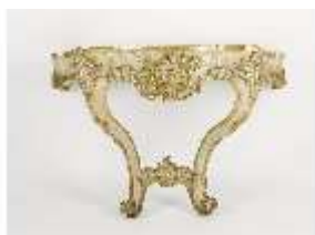
AnsRes.III,M, Konsoltisch (freigelegt), AnsRes.M0068, DI001936, BSV