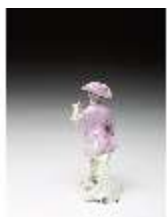
AnsRes.III,K, Knabe mit Blumen, DI016085, BSV-