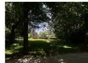
AnsRes.V, Hofgarten, Jägerwiese, DI022310, BSV