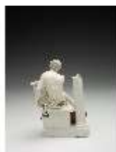
AnsRes.III,K, Apollo, DI017244, BSV-