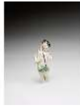
AnsRes.III,K, Putto als Zimmermann, DI016125, BSV-