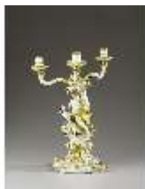
AnsRes.III,K, Standleuchter, Inv.-Nr. AnsRes.K0738, DI012871, BSV-