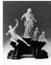
AnsRes.III,P, Allegorie d.Wohlstandes, DE003528, BSV-