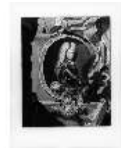
AnsRes.III,G, Mgf. Georg Friedrich, DE003105, BSV-