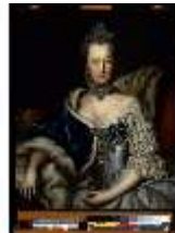
AnsRes.III,G, Markgräfin Friederike Caroline, DE001481, BSV-