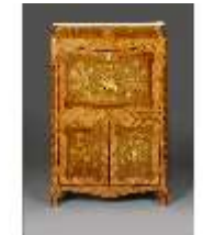
AnsRes.III,M,Schreibschrank "Secrétaire à abattant", Kat.79, DE001436, BSV