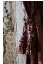
AnsRes.II, Marmorkabinett, R.8, Det. Vorhang, DI023992, BSV-