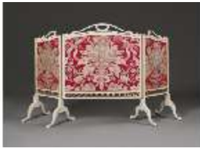
AnsRes.III,M, Ofenschirm, Kat. 94, Audienzzimmer des Markgrafen, R.5, DE001450, BSV