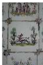
AnsRes.II, Fliese im Fliesensaal, R. 24, DI024055, BSV-