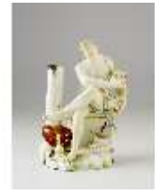
AnsRes.III,K, Apollo, K0537, DI016008, BSV-