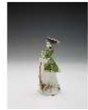
AnsRes.III,K, Jägerin, DI017312, BSV-