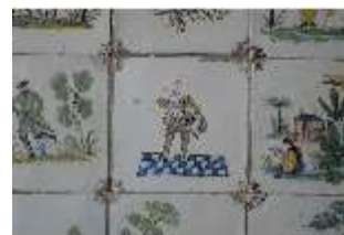
AnsRes.II, Fliese im Fliesensaal, R. 24, DI023968, BSV-