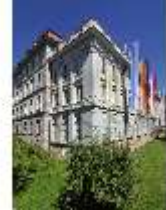
AnsRes.I, Residenz, Detailansicht, DI000687, BSV