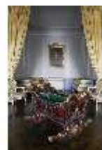
AnsRes.II, Schlafzimmer d. Gästeappartements (R. 20), Prunkwiege, DI024071, BSV-