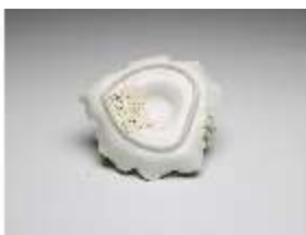
AnsRes.III,K, Handleuchter, DI017340, BSV-