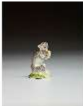
AnsRes.III,K, Kleiner Affe, DI016172, BSV-