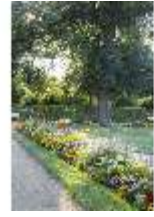
AnsRes.V, Parterre, Blumenrabatte, DI005678, BSV