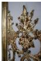
AnsRes.II, Marmorkabinett, R.8, Detail, DI024001, BSV-