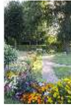
AnsRes.V, Parterre, Blumenrabatte, DI005677, BSV