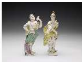
AnsRes.III,K, Europa und Amerika, DI017341, BSV-