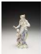
AnsRes.III,K, Venus mit Amor, DI017212, BSV-