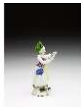
AnsRes.III,K, Bulgarisches Mädchen, DI016088, BSV-