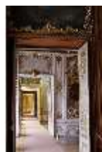
AnsRes.II, Enfilade, DI013323, BSV-