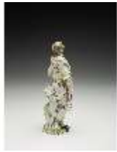
AnsRes.III,K, Aurora, DI017240, BSV-