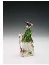
AnsRes.III,K, Jägerin, DI017311, BSV-