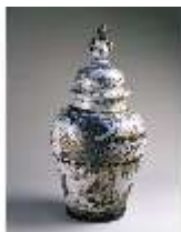
AnsRes.III, K, Deckelvase, K 199.03, DE003045, BSV-