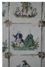
AnsRes.II, Fliese im Fliesensaal, R. 24, DI024051, BSV-