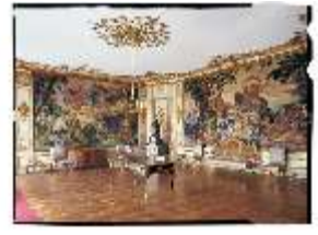
AnsRes.II, Gobelinzimmer oder zweites Vorzimmer der Markgräfin R.14, DE003222, RSV-