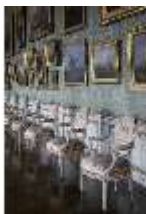
AnsRes.II, Galerie (R. 26), DI013335, BSV-