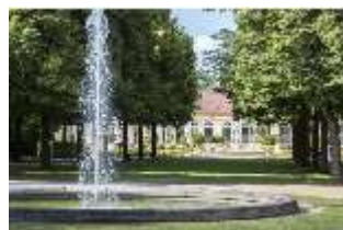
AnsRes.V, Parterre und Orangerie, DI005636, BSV