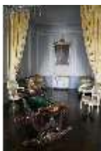
AnsRes.II, Schlafzimmer d. Gästeappartements (R. 20), Prunkwiege, DI024073, BSV-