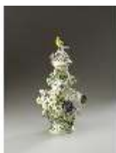
AnsRes.III,K, Potpourrivase, Inv.-Nr. AnsRes.K0705, DI012840, BSV-