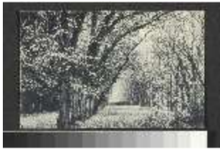
AnsRes.III,V, hist. Postkarte vom Hofgarten Ansbach, DI020356, BSV