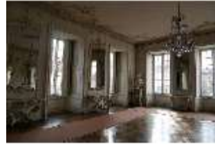
AnsRes.II, Zweites Vorzimmer des Markgrafen (R.4), DI013328, BSV-