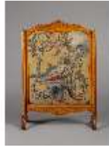
AnsRes.III,M,Ofenschirm, Kat.29, R.8, DE001425, BSV