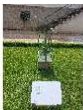
AnsRes.VII, Kräuterausstellung "Kräuterfarben" (2023), DI026681 BSV.