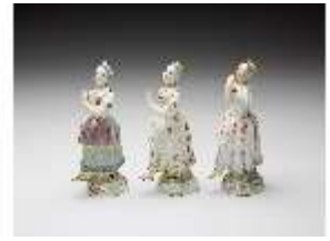
AnsRes.III,K, Tanzende Mädchen, DI017349, BSV-