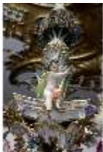
AnsRes.III,K, Kronleuchter (Detail); AnsRes.K0737, DI022268, BSV