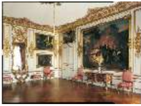
AnsRes.II, R13, Jagdzimmer, DE003217, BSV-