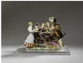
AnsRes.III,K, Gruppe "Der Herzdosenkauf", Inv.-Nr. AnsRes.K0502, DI012820, BSV-