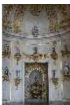
AnsRes.II, Festsaal (R. 2), Schranknische, DI013332, BSV-