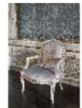
AnsRes.II, Audienzzimmer d. Gästeappartements (R. 21), DI024085, BSV-