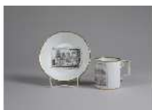
AnsRes.III,K, Tasse mit Untertasse, AnsRes.K0496, DI022250, BSV