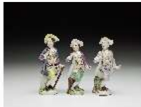
AnsRes.III,K, Schäferjunge Serie „Kleine Gärtnerkinder“, DI016182, BSV-