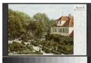
AnsRes.III,V, hist. Postkarte vom Hofgarten Ansbach, DI020354, BSV