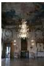
AnsRes.II, Festsaal (R. 2), DI013353, BSV-