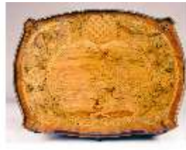
AnsRes.III,M, Ziertischchen "Table à Écrire", Inv. AnsRes.M0061, R.7, DE001421 BSV