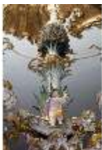
AnsRes.III,K, Kronleuchter (Detail); AnsRes.K0737, DI022272, BSV