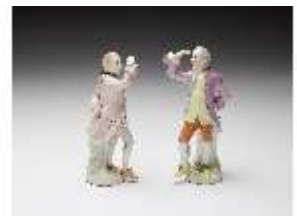
AnsRes.III,K, Kavaliere, DI017347, BSV-