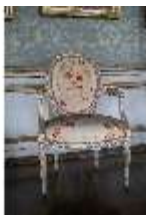
AnsRes.II, Galerie (R. 26), Armlehnsessel, DI024094, BSV-