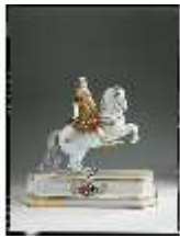
AnsRes.III,K, August der Starke von Polen, K 521, DE002361, BSV-