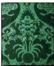
AnsRes.II, Bilderkabinett, Tapete, DE003230, BSV-