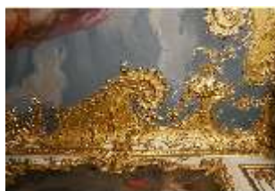
AnsRes.II, Spiegelkabinett, Det. Decke, R. 10, DI023981, BSV-