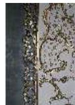
AnsRes.II, Audienzzimmer d. Gästeappartements (R. 21), DI024088, BSV-