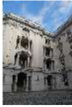
AnsRes.I, Arkadenhof, DI024120, BSV-