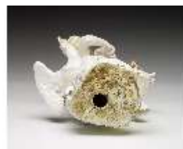
AnsRes.III,K, Jupiter, DI016071, BSV-