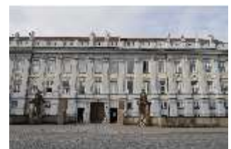
AnsRes.I, Residenz, Hauptfassade, DI024126, BSV-