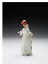
AnsRes.III,K, Pascha, DI017283, BSV-