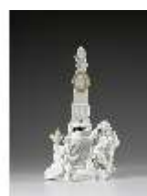
AnsRes.III,K, Erstes Gellert-Monument, Inv.-Nr. AnsRes.K1234, DI012877, RSV-