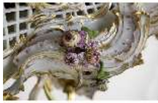
AnsRes.III,K, Kronleuchter (Detail); AnsRes.K0737, DI022257, BSV