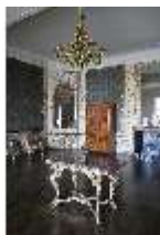
AnsRes.II, Audienzzimmer d. Gästeappartements (R. 21), DI024084, BSV-