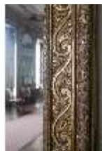
AnsRes.II, Galerie (R. 26), Detail Spiegelrahmung, DI024102, BSV-