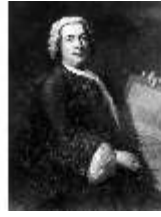
AnsRes.III, Porträt Retti (R.Nickele) AnsG2, DE001787, BSV-