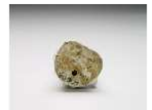
AnsRes.III,K, Tartarin, DI017322, BSV-