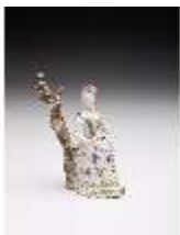
AnsRes.III,K, Mädchen mit Notenblatt, DI017304, BSV-