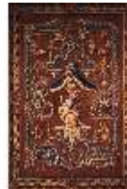
AnsRes.III, Groteskentepich "Ceres", DE002193, BSV-