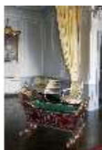
AnsRes.II, Schlafzimmer d. Gästeappartements (R. 20), Prunkwiege, DI024068, BSV-