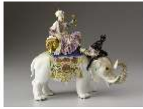
AnsRes.III,K, Sultan auf Elefant, Inv.-Nr. AnsRes.K0504, DI012827, RSV-