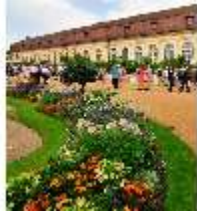
AnsRes.V, Hofgarten und Orangerie, DI000685, BSV