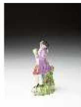
AnsRes.III,K, Obsthändler, DI016105, BSV-