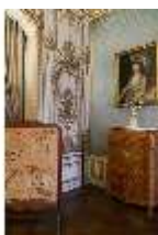
AnsRes.II, Schlafzimmer der Markgräfin (R. 9), DI013319, BSV-