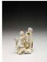
AnsRes.III,K, Winter, Puttengruppe, DI017221, BSV-