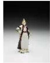
AnsRes.III,K, Türke mit Pelzmantel, DI017278, BSV-