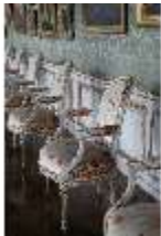
AnsRes.II, Galerie (R. 26), DI024098, BSV-