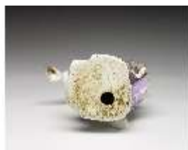
AnsRes.III,K, Juno, DI016066, BSV-