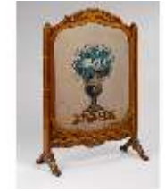
AnsRes.III,M,Ofenschirm, Kat.29, R.15, DE001426, BSV