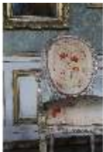
AnsRes.II, Galerie (R. 26), DI024043, BSV-