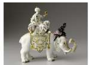
AnsRes.III,K, Sultan auf Elefant, Inv.-Nr. AnsRes.K0503, DI012825, BSV-