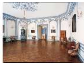
AnsRes.II, Erstes Vorzimmer der Markgräfin R.15, DE003220, BSV-