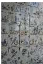
AnsRes.II, Fliesen im Fliesensaal, R. 24, DI023975, BSV-