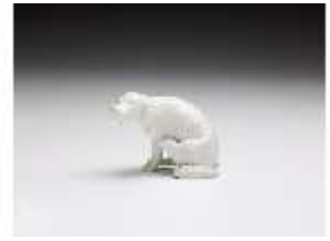
AnsRes.III,K, Jagdhund, DI017327, BSV-