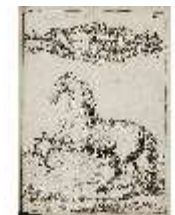
AnsRes.III,V, Der vollkommene Pferde-Kenner, DI015956, BSV-