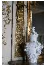
AnsRes.III,K, Deckelvase, Inv.-Nr. AnsRes.K0728, DI024089, BSV-