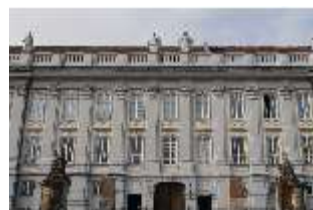
AnsRes.I, Residenz, Hauptfassade, DI024124, BSV-