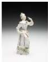
AnsRes.III,K, Tanzendes Mädchen, DI017260, BSV-