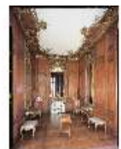
AnsRes.II, Braunes Kabinett R.7, DE003208, BSV-