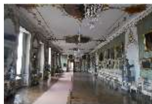
AnsRes.II, Galerie (R. 26), DI013336, BSV-