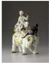
AnsRes.III,K, Sultan auf Elefant, Inv.-Nr. AnsRes.K0503, DI012826, RSV-