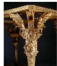
AnsRes.III,M,Tisch mit Drachenbeinen, Kat.6, R.21, DE001435, BSV