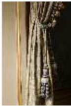
AnsRes.II, Schlafzimmer der Markgräfin, Vorhang (Det.), DI023982, BSV-