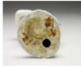
AnsRes.III,K, Apollo, DI017249, BSV-