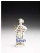
AnsRes.III,K, Schäferin, DI017291, BSV-