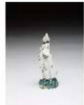
AnsRes.III,K, Miniaturfigur einer Dame, DI016052, BSV-