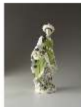
AnsRes.III,K, Malabarin, Inv.-Nr. AnsRes.K0526, DI012837, BSV-