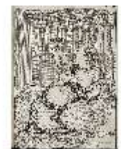
AnsRes.III,V, Der vollkommene Pferde-Kenner, DI015960, BSV-