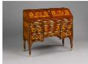
AnsRes.III,M,Pultsekretär, Kat.24, R.22, DE001420, BSV