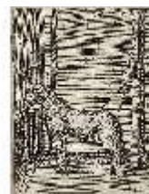
AnsRes.III,V, Der vollkommene Pferde-Kenner, DI015972, BSV-