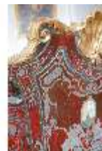
AnsRes.II, Schlafzimmer d. Gästeappartements (R. 20), Prunkwiege, DI024081, BSV-