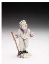
AnsRes.III,K, Knabe mit Hirtenstab, DI017299, BSV-