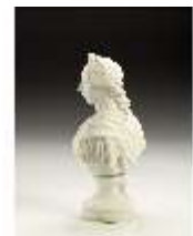
AnsRes.III,K, Büste Kaiser Joseph II., AnsRes.K1232, DI022697, BSV-