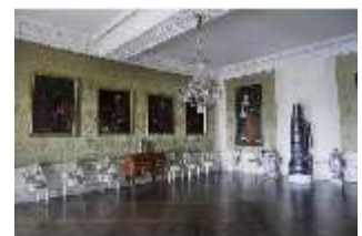
AnsRes.II, Zweites Vorzimmer, Gästeappartements, R. 22, DI013342 BSV-