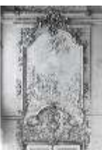
AnsRes.II, Supraportenrelief/Süd, R.2, DE003764, BSV-