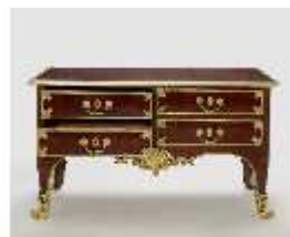
AnsRes.III,M, Kommode, Inv.-Nr.: AnsRes.M0004, DI025719, BSV