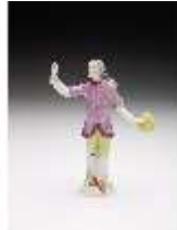
AnsRes.III,K, Tanzender Kavaliere, DI017334, BSV-