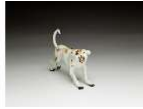
AnsRes.III,K, Windhund, DI016165, BSV-