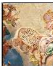
AnsRes.II, Festsaal, Deckenfresko, Detail, DE001579, BSV-