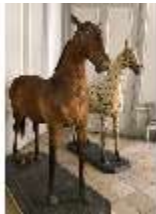
AnsRes.III,P, Pferdepräparate, DI018742, BSV-