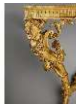
AnsRes.III,M,Konsoltisch (von einem Paar), Detail, Kat.11, Galerie, R.26, DE001424, BSV