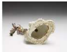
AnsRes.III,K, Mädchen mit Notenblatt, DI017305, BSV-