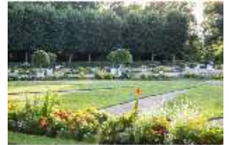
AnsRes.V, Parterre, Blumenrabatten, DI005684, BSV