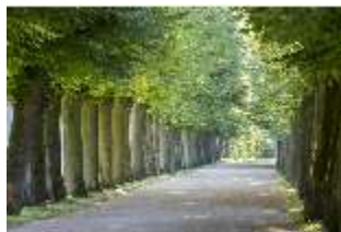
AnsRes.V, Lindenallee, DI005656, BSV