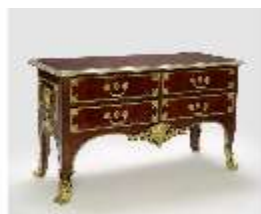
AnsRes.III,M, Kommode, Inv.-Nr.: AnsRes.M0004, DI025721, BSV