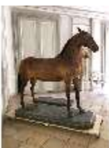
AnsRes.III,P, Pferdepräparat, DI018744, BSV-