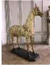
AnsRes.III,P, Pferdepräparat, DI018735, BSV-