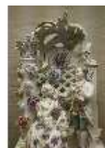
AnsRes.III,K, Liebespaar in der Laube, AnsRes.K0507, DI023957, BSV-