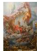
AnsRes.II, Spiegelkabinett, Det. Deckengemälde, R. 10, DI023980, BSV-