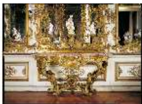
AnsRes.II, Spiegelkabinett R.10, Konsoltisch, DE001511, BSV