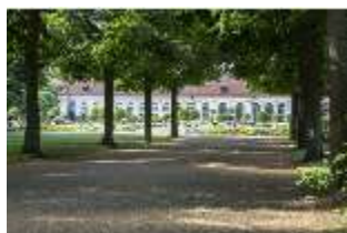
AnsRes.V, Parterre und Orangerie, DI005698, BSV