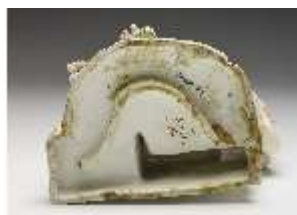
AnsRes.III,K, Apollo, DI017245, BSV-