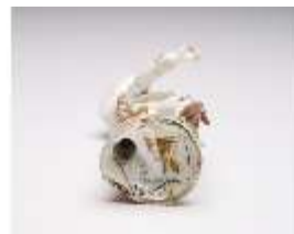
AnsRes.III,K, Gärtner, DI017333, BSV-