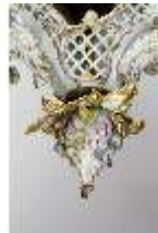
AnsRes.III,K, Kronleuchter (Detail); AnsRes.K0737, DI022266, BSV