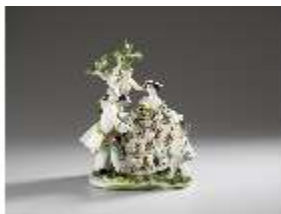
AnsRes.III,K, Die Verlobung, AnsRes.K0513, DI012830, BSV-