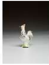
AnsRes.III,K, Kleiner Hahn, DI016146, BSV-