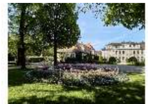
AnsRes.V, Hofgarten, DI022311, BSV