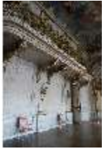
AnsRes.II, Festsaal, R. 2, DI024038, BSV-