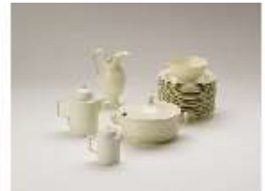
AnsRes.III,K, Service, Inv. AnsRes.K1209, DI014401, BSV-