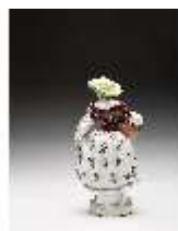
AnsRes.III,K, Gärtnerin, DI016075, BSV-