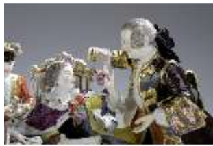
AnsRes.III,K, Gruppe "Der Herzdosenkauf", Inv.-Nr. AnsRes.K0502, DI012821, BSV-