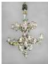
AnsRes.III,K, Kronleuchter (Porzellan); AnsRes.K0737, DI022251, BSV