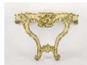
AnsRes.III,M, Konsoltisch (freigelegt), AnsRes.M0066, DI001934, BSV