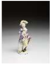
AnsRes.III,K, Knabe als Kavalier mit Blumen, DI016107, BSV-