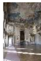
AnsRes.II, Festsaal (R. 2), DI013312, BSV-