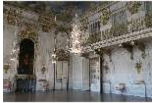
AnsRes.II, Festsaal, R. 2, DI023964, BSV-