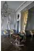
AnsRes.II, Schlafzimmer des Gästeappartements (R. 20) mit Prunkwiege, DI013347, BSV-