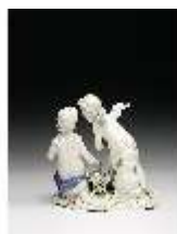
AnsRes.III,K, Zwei Putti mit Blumengirlanden, DI016037, BSV-