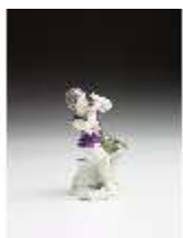
AnsRes.III,K, Knabe mit Trauben, DI016100, BSV-