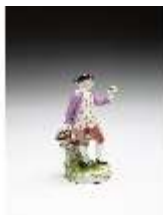
AnsRes.III,K, Obsthändler, DI016104, BSV-