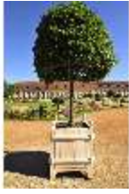
AnsRes.V, Hofgarten und Orangerie, DI000677, BSV