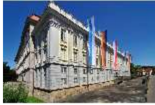
AnsRes.I, Residenz, Hauptfassade, Schrägansicht, DI000688, BSV