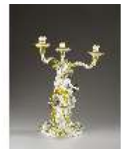
AnsRes.III,K, Standleuchter, Inv.-Nr. AnsRes.K0738, DI012873, BSV-