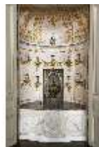
AnsRes.II, Schranknische, Festsaal (R. 2), DI019495, BSV