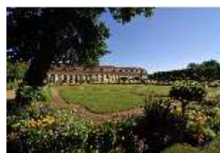
AnsRes.V, Hofgarten und Orangerie, DI000675, BSV