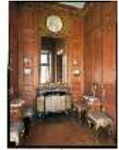
AnsRes.II, Kabinett, R.19, DE003224, BSV-