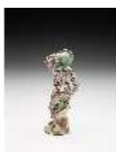
AnsRes.III,K, Harlekin, DI017308, BSV-