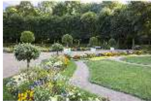
AnsRes.V, Parterre, Blumenrabatten, DI005674, BSV