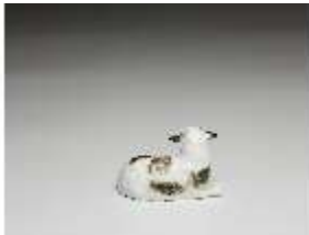
AnsRes.III,K, Liegendes Schaf, DI016149, BSV-