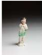
AnsRes.III,K, Putto mit Triangel, DI016126, BSV-