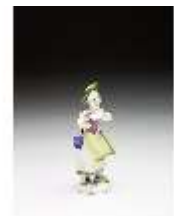
AnsRes.III,K, Bulgarisches Mädchen, DI016089, BSV-