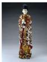
AnsRes.III,K, Göttin Guanyin, AnsRes.K523, DE003052, BSV-