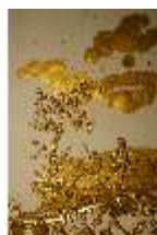
AnsRes.II, Schlafzimmer der Markgräfin, Deckenstück, DI023987, BSV-