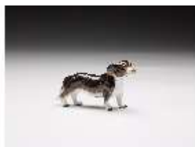
AnsRes.III,K, Stehender Dachshund, DI017323, BSV-