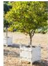
AnsRes.V, Pflanzkübel, DI005659, BSV