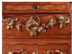
AnsRes.III,M, Kommode, Detail, R.19, DE002898, BSV