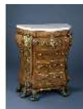
AnsRes.III,M, Kommode, Kabinett des Gästeappartement, R.19, DE002897 BSV