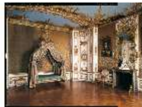
AnsRes.II, Schlafzimmer R.6, DE003212, BSV-