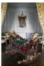
AnsRes.II, Schlafzimmer d. Gästeappartements (R. 20), Prunkwiege, DI024069, BSV-