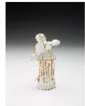
AnsRes.III,K, Türkin mit Kopftuch, DI017297, BSV-