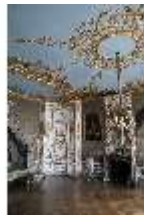
AnsRes.II, Schlafzimmer des Markgrafen, R. 6, DI024000, BSV-