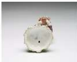
AnsRes.III,K, Kavalier mit Blumenkorb, DI016099, BSV-