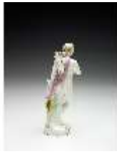
AnsRes.III,K, Apollo, DI017248, BSV-