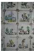
AnsRes.II, Fliesen im Fliesensaal, R. 24, DI024048, BSV-