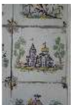
AnsRes.II, Fliese im Fliesensaal, R. 24, DI023971, BSV-