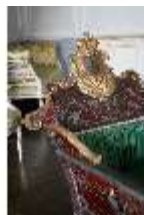
AnsRes.II, Schlafzimmer d. Gästeappartements (R. 20), Prunkwiege, DI024080, BSV-