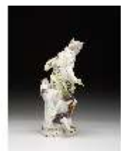
AnsRes.III,K, Venus mit Amor, DI016115, BSV-