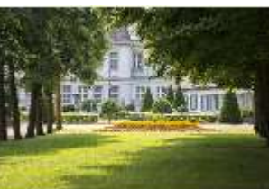
AnsRes.V, Parterre, Blick aus der Allee, DI005642, BSV