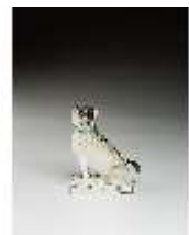
AnsRes.III,K, Mops auf Kissen, DI016161, BSV-