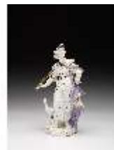
AnsRes.III,K, Juno, DI016063, BSV-