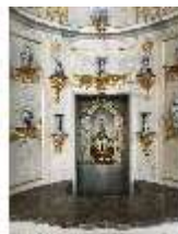
AnsRes.II, Schranknische, Festsaal (R. 2), DI019496, BSV