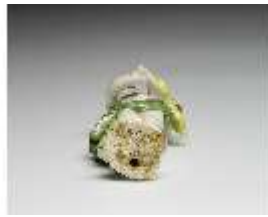
AnsRes.III,K, Putto mit Drehleier, DI016124, BSV-