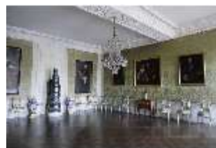
AnsRes.II, Zweites Vorzimmer, Gästeappartements, R. 22, DI013341 BSV-