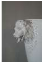
AnsRes.III,K, Deckelvase mit Löwenkopfenkeln, AnsRes.K0494, DI024029, RSV-