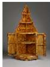
AnsRes.III,M,Eckschrank, Braunes Kabinett im App. des Markgrafen, R.7, DE001419, BSV