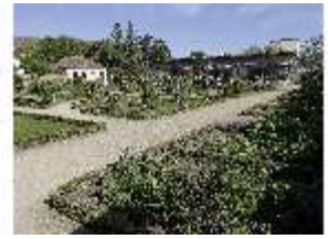
AnsRes.V, Leonhart-Fuchsgarten, DI022329, BSV-