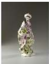
AnsRes.III,K, Malabarin, Inv.-Nr. AnsRes.K0524, DI012834, BSV-