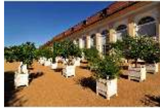
AnsRes.V, Hofgarten und Orangerie, DI000705, BSV