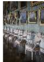
AnsRes.II, Galerie (R. 26), DI024046, BSV-