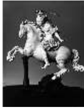
AnsRes.III, P, Marcus Curtius, R.7, DE003527, BSV-