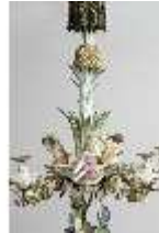
AnsRes.III,K, Kronleuchter (Detail); AnsRes.K0737, DI022262, BSV