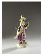
AnsRes.III,K, Malabare mit Musikinstrument, Inv.-Nr. AnsRes.K0527, DI012839, BSV-