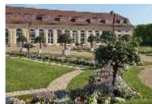
AnsRes.V, Hofgarten, Orangerie mit Parterre, DI022301, BSV