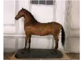
AnsRes.III,P, Pferdepräparat, DI018737, BSV-