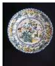
AnsRes.III, Fayence Teller, DE003041, BSV-