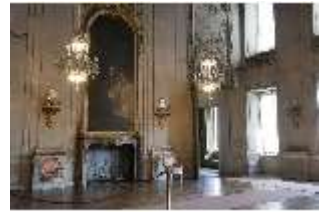
AnsRes.II, Festsaal, R. 2, DI024041, BSV-