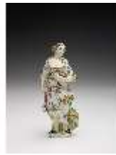
AnsRes.III,K, Aurora, DI017238, BSV-