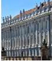
AnsRes.I, Residenz, Hauptfassade, Detailansicht, DI000686, BSV