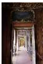
AnsRes.II, Enfilade, DI013322, BSV-