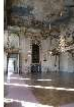
AnsRes.II, Festsaal, R. 2, DI023966, BSV-