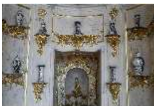
AnsRes.II, Schranknische, Festsaal (R. 2), DI024034, BSV-