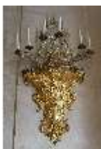
AnsRes.II, Standleuchter im Festsaal, R. 2, DI023965, BSV-