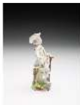
AnsRes.III,K, Gärtner, DI017331, BSV-