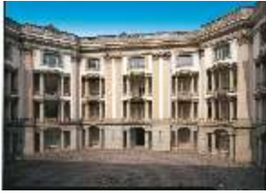
AnsRes.I, Arkadenhof, DE001167, BSV-