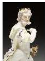
AnsRes.III,K, Jupiter, DI016070, BSV-