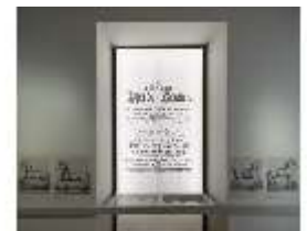
AnsRes.VII, Dauerausstellung Pferde, DI022324, BSV