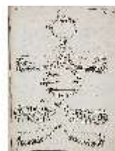
AnsRes.III,V, Der vollkommene Pferde-Kenner, DI015976, BSV-