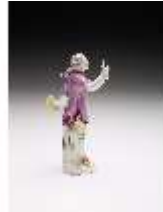
AnsRes.III,K, Tanzender Kavaliere, DI017335, BSV-