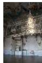
AnsRes.II, Festsaal (R. 2) mit Schranknische, DI013329, BSV-