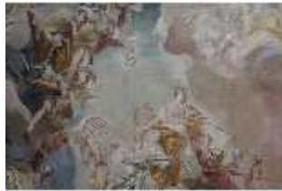
AnsRes.II, Festsaal, R. 2, Detail Deckengemälde, DI024110, BSV-