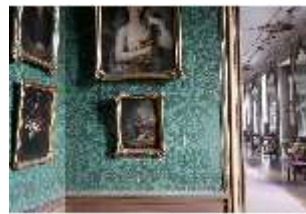
AnsRes.II, Bilderkabinett, R. 27, DI024104, BSV-