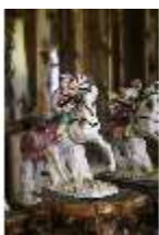
AnsRes.II., Spiegelkabinett im Appartement der Markgräfin (R. 10), DI013315, BSV-