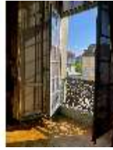
AnsRes.II, Geöffnetes Fenster im Spiegelkabinett (?), DI021346, BSV-