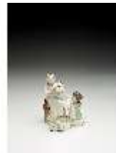
AnsRes.III,K, Winter, Puttengruppe, DI017218, BSV-