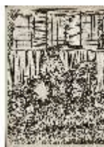
AnsRes.III,V, Der vollkommene Pferde-Kenner, DI015967, BSV-