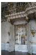
AnsRes.II, Schranknische, Festsaal (R. 2), DI024112, BSV-