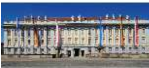
AnsRes.I, Residenz, Hauptfassade, DI000690, BSV