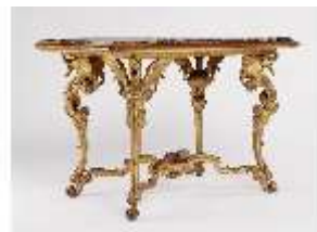
AnsRes.III,M,Tisch mit Drachenbeinen, Kat.6, R.21, DE001433, BSV