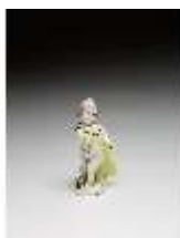
AnsRes.III,K, Putto als Maler, DI016131, BSV-