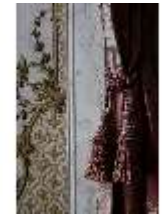
AnsRes.II, Marmorkabinett, R.8, Det. Vorhang, DI023993, BSV-