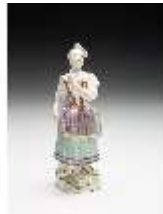
AnsRes.III,K, Tanzendes Mädchen, DI017275, BSV-