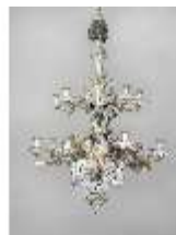
AnsRes.III,K, Kronleuchter (Porzellan); AnsRes.K0737, DI022252, BSV