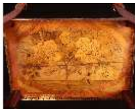
AnsRes.III,M, Ziertischchen "Table à Écrire", Inv. AnsRes.M0061, R.7, DE001429 BSV