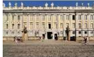
AnsRes.I, Residenz, Hauptfassade, DI000693, BSV