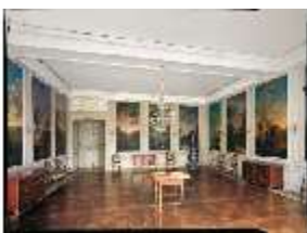
AnsRes.II, Monatszimmer R.23, DE003227, BSV-