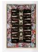
AnsRes.III,M, Spieltischplatte, M 111, DE001376, BSV-