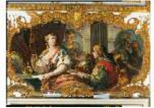
AnsRes.II, Audienzzimmer des Markgrafen, Supraporte, Dido, DE003210, BSV