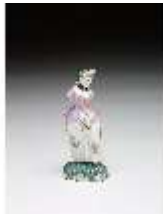
AnsRes.III,K, Miniaturfigur einer Dame, DI016086, BSV-