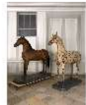
AnsRes.III,P, Pferdepräparate, DI018741, BSV-