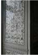
AnsRes.II, Fliesensaal, "Ordinäres Tafelzimmer", R. 24, DI024062, BSV-