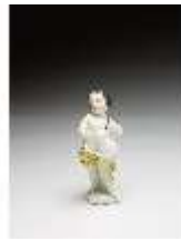
AnsRes.III,K, Putto mit Gießkanne, DI016128, BSV-