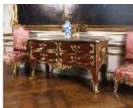
AnsRes.III, Kommode, französisch, 1725, DE002418, BSV-