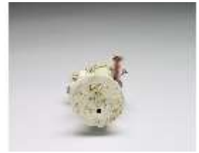
AnsRes.III,K, Knabe als Kavalier mit Blumen, DI016110, BSV-