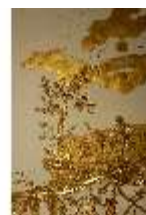
AnsRes.II, Schlafzimmer der Markgräfin, Deckenstück, DI023988, BSV-