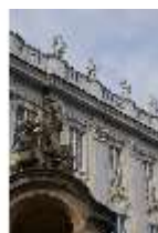
AnsRes.I, Residenz, Hauptfassade m. Wachhaus/Schilderhaus, DI024129, BSV-