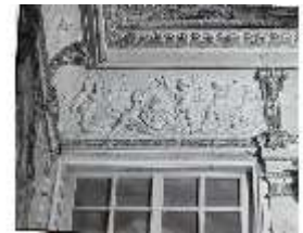
AnsRes.II, Relief "Februar ...", R.2, DE003767, BSV-