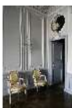
AnsRes.II, Schlafzimmer d. Gästearrappements (R. 20), DI024074, BSV-