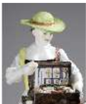
AnsRes.III,K, Gruppe "Der Herzdosenkauf", Inv.-Nr. AnsRes.K0502, DI012824, BSV-