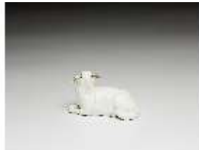
AnsRes.III,K, Liegendes Schaf, DI016150, BSV-