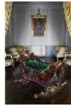
AnsRes.II, Schlafzimmer des Gästeappartements (R. 20) mit Prunkwiege, DI013344, BSV-