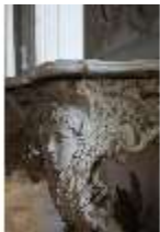
AnsRes.II, Zweites Vorzimmer des Markgrafen (R.4), Konsoltisch, DI024013, BSV-