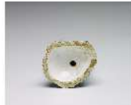
AnsRes.III,K, Miniaturfigur einer Dame, DI016087, BSV-