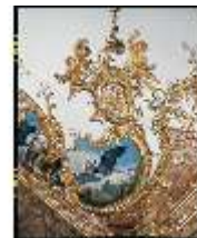
AnsRes.II, Schlafzimmer R.6, Detail des Deckenschmucks, DE003214, BSV-