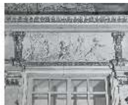
AnsRes.II, Relief "Luft", R.2, DE003778, BSV-