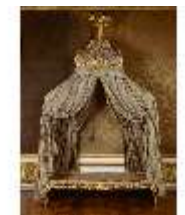
AnsRes.III,M,Bett "Lit à la Polonaise", Kat.66, DE001440, BSV