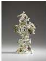
AnsRes.III,K, Phantasieformuhr, Inv.-Nr. AnsRes.K1240, DI012882, RSV-