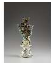
AnsRes.III,K, Ziervase "Wasser", Inv.-Nr. AnsRes.K0716, DI012861, BSV-