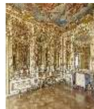
AnsRes.II, Spiegelkabinett im Appartement der Markgräfin, DI016453, BSV