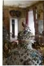
AnsRes.II, Audienzzimmer des Markgrafen, R. 5, Potpourrivase, DI024009, BSV-