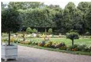
AnsRes.V, Parterre, Blumenrabatten, DI005695, BSV