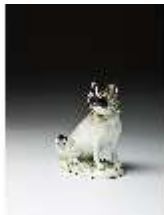
AnsRes.III,K, Größerer Mops, DI016169, BSV-