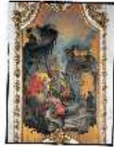
AnsRes.III,G, Allegorie der Trägheit, R.8, DE003234, BSV-