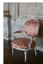
AnsRes.II, Festsaal (R. 2), Armlehnsessel, DI024107, BSV-