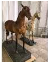
AnsRes.III,P, Pferdepräparate, DI018738, BSV-