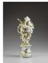
AnsRes.III,K, Ziervase "Luft", Inv.-Nr. AnsRes.K0718, DI012863, BSV-