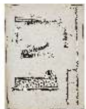
AnsRes.III,V, Der vollkommene Pferde-Kenner, DI015969, BSV-