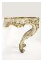
AnsRes.III,M, Konsoltisch (freigelegt), AnsRes.M0068, DI001937, BSV