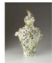
AnsRes.III,K, Potpourrivase, Inv.-Nr. AnsRes.K0707, DI012842, BSV-