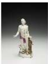
AnsRes.III,K, Meleager, DI017254, BSV-