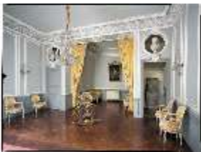
AnsRes.II, Schlafzimmer R.20, DE001510, BSV-