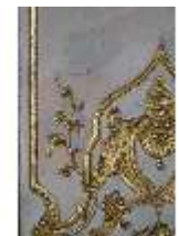
AnsRes.II, Marmorkabinett, R.8, Detail Dekoration, DI023995, BSV-