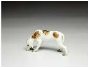
AnsRes.III,K, Jagdhund, DI016163, BSV-