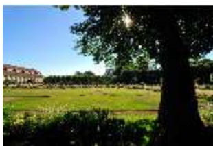
AnsRes.V, Hofgarten, DI000673, BSV