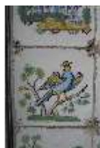
AnsRes.II, Fliese im Fliesensaal, R. 24, DI024090, BSV-