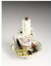
AnsRes.III,K, Girandole, K0745, DI016010, BSV-