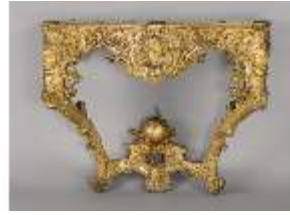
AnsRes.III,M,Konsoltisch, Kat.49, R.14, DE001429, BSV