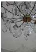
AnsRes.II, Zweites Vorzimmer des Markgrafen (R.4), Kronleuchter, DI024020, BSV-