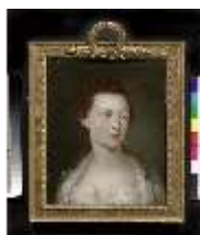
AnsRes.III, Madame Clairon, G0038, DI003097, BSV