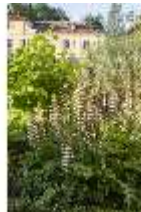
AnsRes.V, Heilkräutergarten, DI005652, BSV