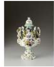
AnsRes.III,K, Balustervase, Inv.-Nr. AnsRes.K0722, DI012865, BSV-