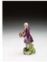
AnsRes.III,K, Kavalier mit Blumenkorb, DI016097, BSV-