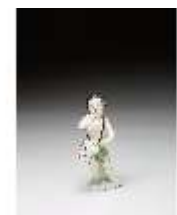
AnsRes.III,K, Putto als Trommler, DI016136, BSV-