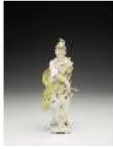
AnsRes.III,K, Europa, DI017226, BSV-