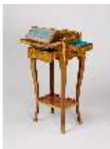
AnsRes.III,M,Ziertischchen "Table à Écrire", R.7, DE001427, BSV