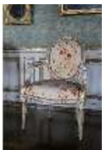
AnsRes.II, Galerie (R. 26), Armlehnsessel, DI024093, BSV-