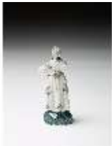
AnsRes.III,K, Miniaturfigur einer Dame, DI016053, BSV-