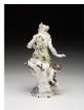
AnsRes.III,K, Venus mit Amor, DI016114, BSV-