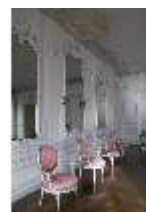
AnsRes.II, Zweites Vorzimmer des Markgrafen (R.4), DI013325, BSV-