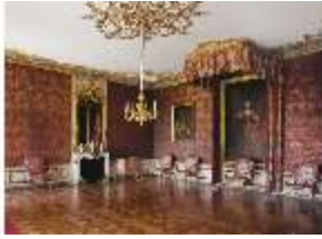
AnsRes.II, Audienzzimmer d.Markgrafen, R.5, DE000886, BSV-