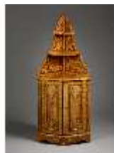
AnsRes.III,M,Eckschrank, Kat.27, R.7, DE001418, BSV