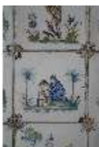
AnsRes.II, Fliese im Fliesensaal, R. 24, DI024053, BSV-