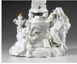
AnsRes.III,K, Erstes Gellert-Monument, Inv.-Nr. AnsRes.K1234, DI012879, BSV-