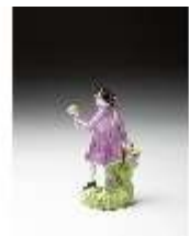
AnsRes.III,K, Obsthändler, DI016106, BSV-