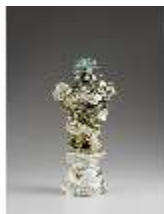
AnsRes.III,K, Ziervase "Erde", Inv.-Nr. AnsRes.K0717, DI012862, BSV-