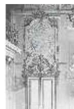
AnsRes.II, Supraportenrelief/Nord, R.2, DE003762, BSV-