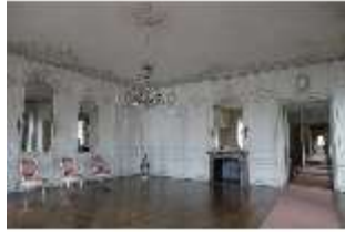
AnsRes.II, Zweites Vorzimmer des Markgrafen (R.4), DI013327, BSV-