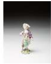
AnsRes.III,K, Kavalier mit Blumen, DI016061, BSV-