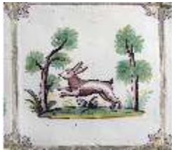
AnsRes.II, Kachel/Fliese mit Hase, Fliesensaal, DI019497, BSV