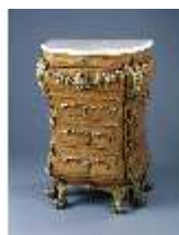
AnsRes.III,M, Kommode, Kabinett des Gästeappartement, R.19, DE002896 BSV