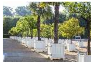
AnsRes.V, Pflanzkübel, DI005658, BSV