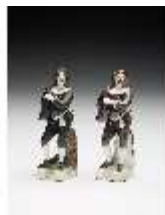
AnsRes.III,K, Scapin, DI017348, BSV-