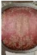
AnsRes.II, Zweites Vorzimmer des Markgrafen (R.4), Armsessel, DI024026, BSV-