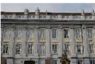
AnsRes.I, Residenz, Hauptfassade, DI024127, BSV-