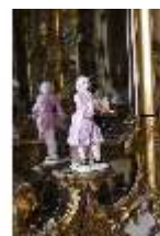
AnsRes.II, Spiegelkabinett im Appartement der Markgräfin (R. 10), DI013314, BSV-