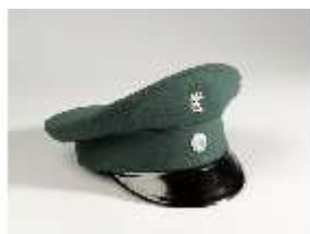
AnsRes.III,V, Grüne Dienstmütze mit Löwenabzeichen, DI002056, BSV