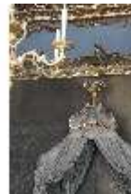
AnsRes.II, Schlafzimmer des Markgrafen, R. 6, DI023956, BSV-