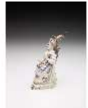
AnsRes.III,K, Mädchen mit Notenblatt, DI017303, BSV-