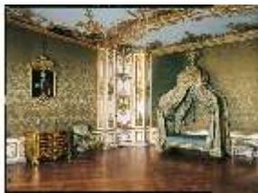
AnsRes.II, Schlafzimmer R.6, DE003207, BSV-