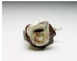
AnsRes.III,K, Türke mit Pelzmantel, DI017280, BSV-