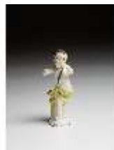
AnsRes.III,K, Putto mit Waldhorn, DI016119, BSV-