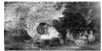
AnsRes.III, G0015.01 Tiergruppe, Samuel Beck, DE000587, BSV-