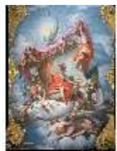
AnsRes.II, Spiegelkabinett R.10, Deckengemälde, DE003235, BSV