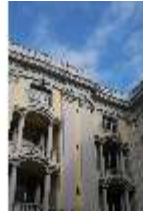
AnsRes.I, Arkadenhof, DI024121, BSV-