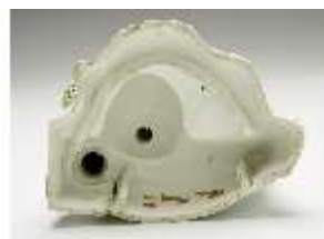
AnsRes.III,K, Liebespaar in der Laube, DI017225, BSV-