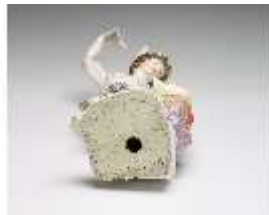
AnsRes.III,K, Merkur, DI016043, BSV-