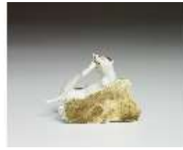
AnsRes.III,K, Jagdhund, DI016159, BSV-