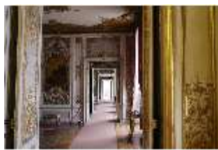
AnsRes.II, Enfilade, DI013317, BSV-