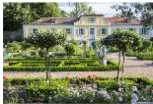
AnsRes.V, Gärtnerwohngebäude im Heilkräutergarten, DI005673, BSV