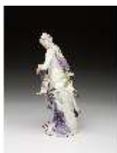
AnsRes.III,K, Venus mit Amor, DI016113, BSV-