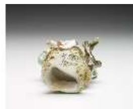
AnsRes.III,K, Klarinettenblasender Hirte, DI017319, BSV-