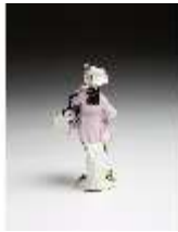
AnsRes.III,K, Trommler, DI016118, BSV-