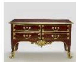
AnsRes.III,M, Kommode, Inv.-Nr.: AnsRes.M0004, DI025720, BSV