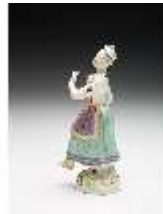
AnsRes.III,K, Tanzendes Mädchen, DI017276, BSV-