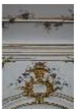
AnsRes.II, Galerie (R. 26), Detail Wanddekoration, DI024096, BSV-