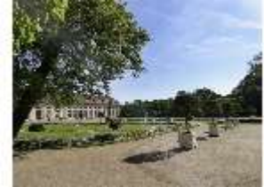
AnsRes.V, Hofgarten und Orangerie von SW, DI022300, BSV