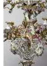
AnsRes.III,K, Kronleuchter (Detail); AnsRes.K0737, DI022263, BSV