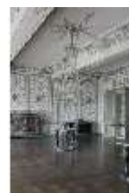
AnsRes.II, Fliesensaal, "Ordinäres Tafelzimmer" R. 24, DI013340, BSV-