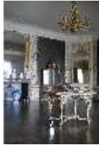
AnsRes.II, Gästeappartement Audienzzimmer (R. 21), DI013343, BSV-