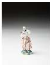
AnsRes.III,K, Bäuerin mit Hahn, DI016091, BSV-