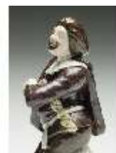
AnsRes.III,K, Scapin, DI017272, BSV-