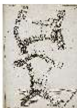
AnsRes.III,V, Der vollkommene Pferde-Kenner, DI015975, BSV-