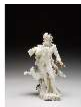
AnsRes.III,K, Jupiter, DI016067, BSV-