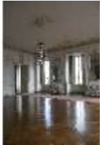
AnsRes.II, Zweites Vorzimmer des Markgrafen (R.4), DI024011, BSV-