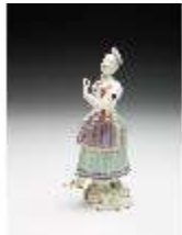
AnsRes.III,K, Tanzendes Mädchen, DI017274, BSV-