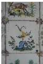
AnsRes.II, Fliese im Fliesensaal, R. 24, DI024050, BSV-