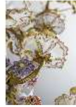
AnsRes.III,K, Kronleuchter (Detail); AnsRes.K0737, DI022259, BSV