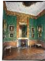
AnsRes.II, Bilderkabinett, DE003229, BSV-