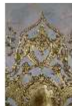
AnsRes.II, Marmorkabinett, R.8, Detail Dekoration, DI023998, BSV-