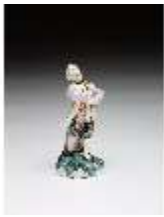
AnsRes.III,K, Kavalier mit Becher, DI016054, BSV-