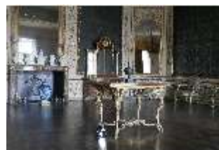
AnsRes.II, Audienzzimmer d. Gästeappartements (R. 21), DI024067, BSV-